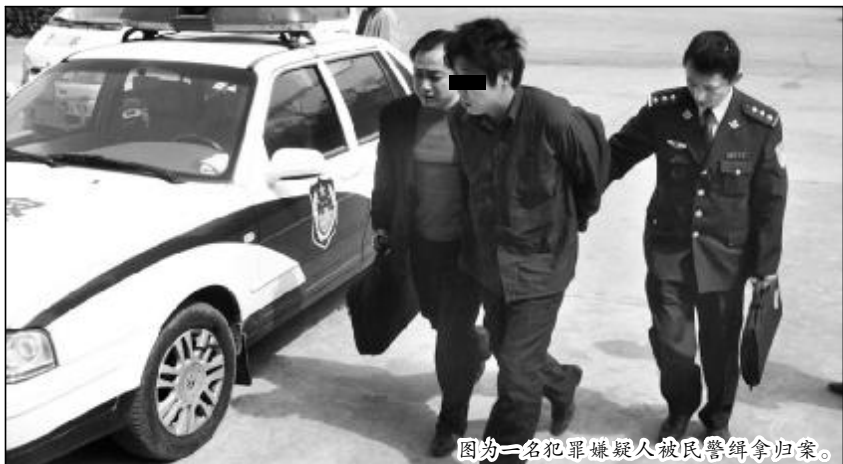
图为一名犯罪嫌疑人被民警缉拿归案。

目前,犯罪嫌疑人中除一人在逃外,其余已被依法刑事拘留。在逃犯罪嫌疑人阮某已上网追捕,此案正在进一步审理之中。(文/图 王卫平)