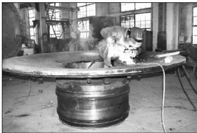
近日，检修分厂充分发挥技术优势，经过7个昼夜奋战，成功修复了氧化铝三车间1号煤磨磨头裂缝，圆满完成焊接、调质工作，为控亏增盈工作节约了近20万元的磨头备件费，为氧化铝生产提供了坚强的设备保证。图为检修人员正在焊接磨头裂缝。

同时安排三支队伍平行作业，保证了工程的进度；项目部与施工队配备两级专职质量检查员对每道工序认真检查，确保了工程质量。为确保安全，项目部专职安全员采取跟踪检查的方式，发现安全隐患及时处理。截至3月31日，两个蓄水池池底及加压泵房底板混凝土已浇筑完毕，完成工程量约40%，以速度快、质量高得到了甲方及监理的一致好评。（高程）