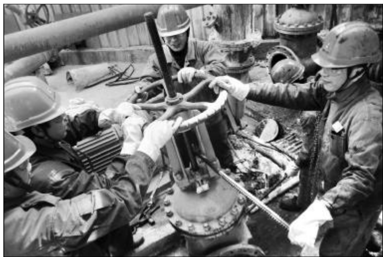
按照中铝山西分公司调整生产运行模式的要求，氧化铝三分厂生产运行模式调整后实现平稳过渡。在2系系列检修中，参加清理检修的七余名员工发扬艰苦奋斗的精神，对沉降系统的混合槽、溢流箱以及流程管道进行了全面的检查清理，为2系氧化铝厂实施202生产方案、两个系列并行投入投用阶段奠定了坚实基础。图为清理检修员工正对沉降底流泵进料阀进行了清理。

多个方面。 各车间严格执行安全四联单制度，加强作业期间断料断电等安全确认的检查，确保槽罐内作业提供安全照明。涉及工艺管网的改造时，要迅速更新操作规程。在实施弹性生产的撤料过程中，制订并实施了详细的操作方案，对停用管道加好插板，强化停用设备放射源的巡检。通过开展深入细致的工作，确保安全万无一失。（张维娟）