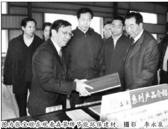
图为张宝顺在晋铝资源综合利用开发有限公司调研。

本报讯 3月27日下午,细雨蒙蒙、空气清新。山西省委书记、山西省人大常委会主任张宝顺在运城市委书记高卫东、河津市委书记崔克信、山西铝厂厂长吴茂森、党委书记郭顺喜的陪同下,到山西铝厂晋铝资源综合利用开发有限公司调研。