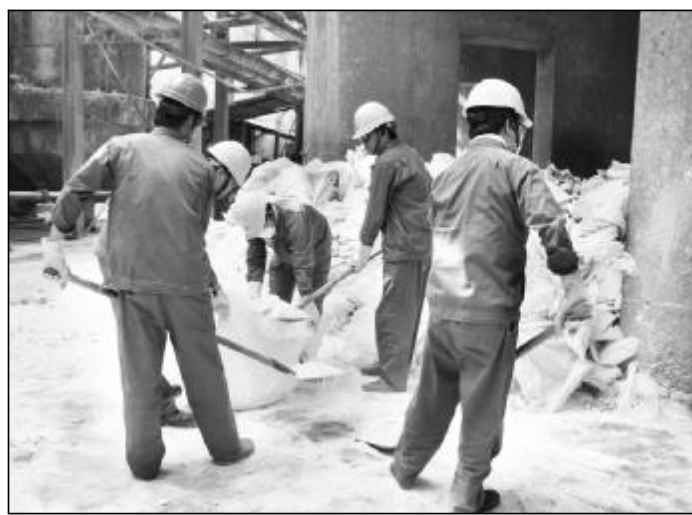
▲在打赢控亏增盈攻坚战中,氧化铝二分厂员工进行化碱搬运做到了一丝不苟,颗粒归仓。图为员工将洒落地面的碱粉回收收到化碱槽内。

此次验收也是东兴物业部深入贯彻落实科学发展观要求,心系住户实现“以人为本”,更好地开展物业服务的具体体现,以期早日让住户乔迁新居,为建成山西企业第一个高标准、高层住宅小区奠定基础。(王中生)