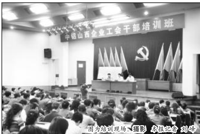
图为培训现场。

作用等。此次干部培训班由山西铝厂工会组织,来自中铝山西企业各二级单位工会主席、工会干事、车间级分会主席、部分工会小组长以及厂工会工作人员200余人参加了培训。