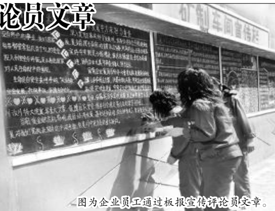
因为企业职工通过板报宣传评论员文章。

工贸公司要求全体员工坚定信心、振奋精神、增强改革创新意识,加大市场开拓力度,力争全面完成