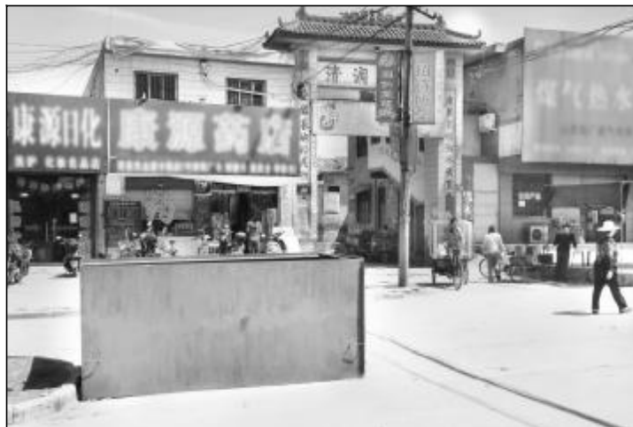
本报5月19日刊登了山西铝厂晋铝路(原十二号路)与清涧新村交叉路口露天堆放垃圾的消息后,有关部门及时进行了协调治理,在原垃圾堆放处增设了一个垃圾箱,将垃圾集中回收处理,如今的环境面貌已大有改观。周围商铺对这种变化由衷的赞叹:再也不受垃圾污染的困扰了!