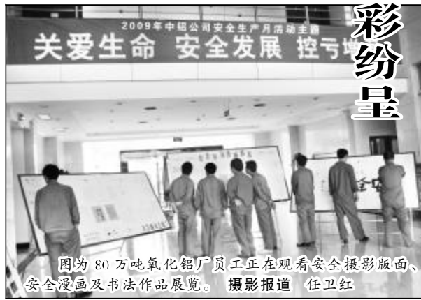
图为 80 万吨氧化铝厂员工正在观看安全摄影版面、安全漫画及书法作品展览。摄影报道 任卫红

6 月 1 日,热电厂精心布置了活动现场,大力营造安全月活动氛围,倡导员工在非常时期为保安全、促生产、全面打赢控亏增盈攻坚战做出应有的贡献;水电分厂在各车间征集安全漫画、安全征文,开展安全生产咨询等活动;煤气分厂利用多种形式进行安全月主题宣传,为随时解答员工提出的有关安全生产的问题,还专门设立安全生产咨询电话;东兴物业部制定了隐患排查治理活动、安全征文、安全板报展评、安全演讲、防震演练等多项活动,进一步增强全员安全意识;检修分厂举办了安全记录、漫画展,以做实、做细、注重实效的原则开展安全活动;氧化铝三分厂七车间注重抓好基础工作、基层建设、基本功训练,引导职工进行自我安全教育,形成相互督促、相互学习、相互提醒的氛围;氧化铝四分厂种分车间开展安全工作“一三三”活动,动员职工积极投身安全管理,强化安全意识,提高安全技能,向安全要效益,为安全生产做贡献。(本报综合报道)