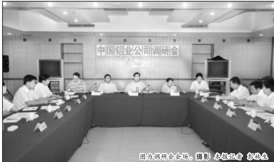
图为调研会会场。

马达卡就山西分公司上半年控亏增盈工作进展情况,下半年工作目标和措施进行了汇报。山西分公司在控亏增盈工作中,严格按照“六个非常”的要求,全面落实“一保二压三从紧”的要求,自加压力,咬定阶段攻坚目标不动摇;快速实施,及时优化调整生产组织方案;扎实开展对标和公关工作;不断优化库存结构,大力压缩库存;艰苦奋斗、勤俭节约,严格控制费用开支;全面强化营销工作,开拓新的市场空间;调整改变考核方式,全方位降低完全成本;从紧项目投资管理,实施短平快项目;狠抓基础管理,推进技术创新;推进机构调整和管理层级变革,加强干部队伍建设。上半年控亏增盈工作取得了一定的成效,1至5月份成本和亏损呈逐渐下降趋势。下半年将采取抓紧组织老系统高水平复产、制定实施低成本领先战略规划、稳步推进管理改革创新、全面加强管理工作等措施,再接再厉、持之以恒,坚决打赢控亏增盈攻坚战。