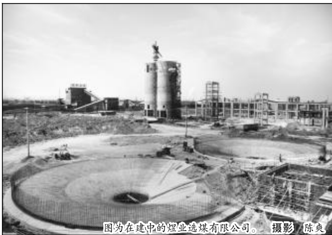
图为在建中的煜业选煤有限公司。

次销售。余热电厂在完善产业链的同时,有效的整合了资源及产品,低消耗、低成本运营,节能降耗效果显著。最大限度地调动和利用各种闲置或废弃资产是节能降耗的一种具体体现。山西铝厂独资子公司晋铝物流有限公司转变观念,对山西碳素厂原有的铁路专用线和站台进行拓展性改造,并与国家铁路交通网进行连网,面向全国开展散装及整装货运业务,形成较大的物流规模,对原有的厂房、道路等设施进行改扩建开展仓储业务,有效地保证了资源的循环和高效利用。