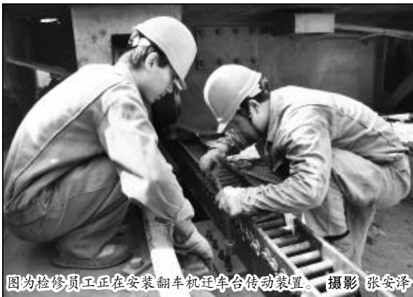
图为检修员工正在安装翻车机迁车台传动装置。

二期翻车机系统改造工程是中铝山西分公司的重点工程,改造完成后将进一步提高翻车机生产能力,减轻员工劳动强度,降低物料倒运费。参加施工的检修分厂高度重视,为确保系统改造高水平、高质量按时完成,根据分公司工程管理部的要求,积极提供工程电力保证,全力以赴服务整体工程的拆除和修复。在机械传动部分改造中,机械制造一车间积极配合,承担了减速机轴及对轮等加工任务,确保了施工进度。在迁车台滚轮改造齿条传动中,检修车间根据现场检查测量,提出利用原有底座加工改造方案,确保了工程的顺利进行。(贾辉)