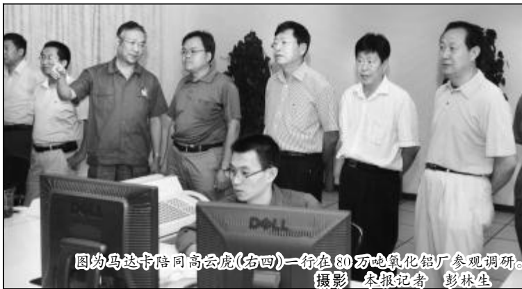
图为马达卡陪同高云虎(右四)一行在80万吨氧化铝厂参观调研。

据悉,此次调研的目的是为组织制定好中部地区钢铁、石化等重点行业的结构调整方案,重点支持钢铁、化工、有色、建材等优势产业结构调整和优化升级,最终形成《促进中部地区原材料结构调整和优化升级方案》。