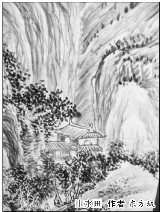
山水画 作者 东方城