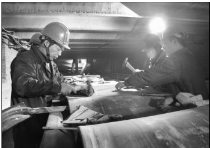
12月15日,氧化铝四分厂检修车间一队职工连续奋战11小时,对氧化铝运输皮带进行紧急检修,更换皮带100余米,同时对部分磨损严重的托辊、皮带支架进行矫正更换。图为检修人员正在现场粘补皮带。

80万吨氧化铝厂针对生产重点环节,全面开展了十项技术攻关。合理调整矿石堆存量,科学组织原料磨及石灰窑运行,采取降低焙烧系统风机转速和精确控制平盘洗水用量等措施,实现每吨氧化铝电耗比计划值降低29.49度;优化分种系统物料指标,使焙烧炉主炉温度逐步降低,控制在1090℃左右,两台焙烧炉运行稳定并保持高产,每吨氧化铝焦炉煤气单耗比计划降低9.27标准立方米;对蒸发系统及时进行酸洗、水洗,提高传热效率,保障溶出系统满负荷平稳运行,避免了非计划停车。(郭智峰 周永胜)