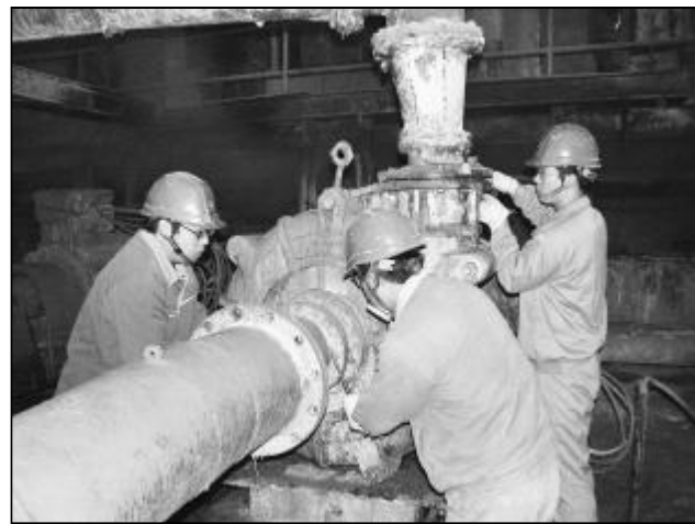
氧化铝一分厂检修车间实施检修工时制考核以来,员工工作积极性不断提高,为提高设备的完好率、运转率创造了有利条件。图为检修人员对格子磨缓冲泵进行维护。

严抓管理出成效,翠溪小区安全文明施工已多次受到天津市城建局、安检站等单位肯定和表扬。(高程)