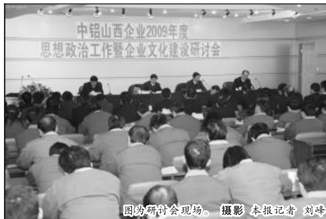
图为研讨会现场。

郭顺喜结合企业当前形势作了重要讲话（全文另发）。他强调了三点意见：一要深入总结，精心提炼，巩固推广；二要融入中心，把握机遇，大力创新；三要加强领导，提高认识，发挥作用。他号召广大干部职工要以十七届四中全会为指导，深入学习实践科学发展观，在中铝公司党组的坚强领导下，团结一致，顽强拼搏，在新的一年里，以良好的精神状态，推进企业结构调整和管理改革创新，为促进企业实现又好又快发展而努力奋斗。