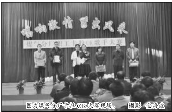
图为煤气分厂卡拉OK大赛现场。

本报讯 近日,中铝山西企业各单位纷纷举行丰富多彩的迎新年文艺活动,从企业生产一线到后勤服务单位,从离退休职工到幼儿稚子,广大干部职工在繁忙和喜庆中迎接新年的到来。