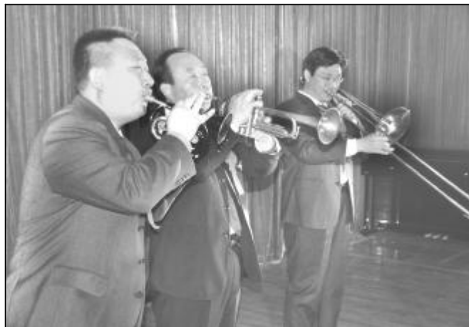
12月25日,天津市音乐家协会在天津成立大会,来自企业及天津市的数十名音乐爱好者参加了会议。音乐协会的成立搭建了企业融入社会的又一桥梁,为丰富职工群众文化生活、促进企业精神文明建设起到积极作用。图为协会成立大会上企业音乐爱好者同台演出。

近年来,特别是企业面临前所未有严峻形势的一年,离退休管理服务中心党委紧密结合企业实际,根据离退休职工的特点和规律,紧紧围绕深化主题教育、开展目标创建、实施关爱服务和达到健康快乐四大主题活动,进一步健全和完善离退休职工思想政治工作的新格局,着力推进“两个待遇”的落实和“六个老有”的实现,团结好、调动好、发挥好广大离退休内退职工的积极性,坚决支持企业打赢降本增效攻坚战,为促进企业生存发展献计出力。