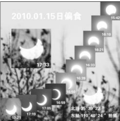
图为铝城日偏食全过程。摄影 薛志礼

据了解,此次日环食将于北京时间15日13时13分55秒从中非西部开始,环食带经过印度洋北部、印度极南部、斯里兰卡北部、缅甸,于16时37分从中缅边境云南省瑞丽地区进入我国,16时59分01秒在我国胶东半岛结束。我国云南中部、四川南部、贵州北部、重庆大部、陕西东南部、湖南西北部、湖北大部、河南大部、安徽北部、江苏北部、山东大部可以看到环食,其他地区(除黑龙江极东端)可看到日偏食。