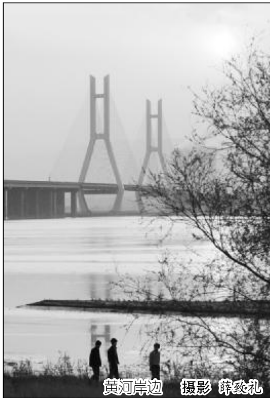
黄河岸边

在这样的班组长，日子谈不上精彩，却很实在，偶有争吵但很和谐。时间在流逝，感情却在慢慢积累。这个大家庭，真是给大家带来不少温暖呢！