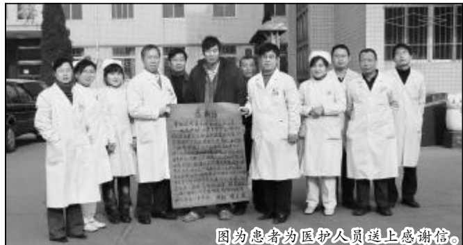
图为患者为医护人员送上感谢信。

职工医院不断加强内涵建设,提升管理水平,全院医护人员努力学习业务知识,勇于探索,使常见病诊治水平及处理高危和复杂手术的综合能力得到进一步提高。(文/图 范军枝)