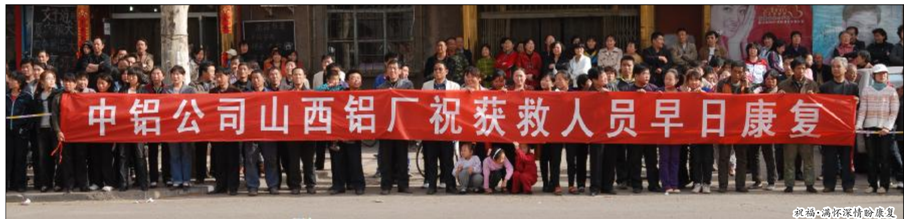
祝福·满怀深情盼康复