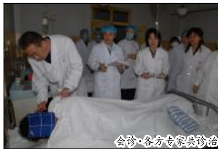
会诊·各方专家共诊治