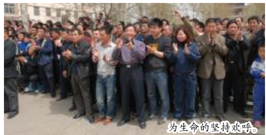
为生命的坚持欢呼。

“第十个、第十一个、第十二个……”“好……”欢呼、雀跃，掌声雷动。4月5日11时50分，王家岭煤矿获救矿工陆续被送往山西铝厂职工医院，医院门口周围沿街聚满了围观的民众，每一辆救护车的驶来大家都报以最热烈的掌声，人们欢呼着，互相传递着最新的信息，是呀，192个小时争分夺秒的救援、192个小时的翘首企盼、192个小时生命的顽强支撑，矿工们陆续获救了，善良的人们，始终关注着、牵挂着矿工。人们自发的聚到山西铝厂医院门口，热烈的欢呼着生命的奇迹，为矿工、为救援的人、为矿工们的家属，欢呼、欢呼。不知何时一位老者写好了一条“共产党与矿工心连心”的标语贴在了医院门前的路灯杆上，歪歪扭扭的几个大字使人群再次发出热烈的欢呼声。是呀，没有党中央国务院的高度重视，不惜一切代价争分夺秒的救援哪会有今天生命的奇迹。 “又送来一个，太好了。”掌声欢呼声再次响起。