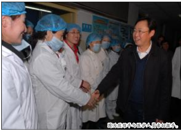
图为熊维平与医护人员亲切握手。

在职工医院急诊部楼前，熊维平一下车便紧紧握住山西省医疗专家的手，连声说“你们辛苦了！”。在急诊部门诊大厅，熊维平对医护人员满怀深情地说：“感谢你们抢救医疗护理了36位获救的工人兄弟。3·28矿难发生以来，153名被困人员牵动着党中央、国务院和全国人民的心，也牵动了24万中铝员工的心。首批9名矿工兄弟在第一时间被送到山西铝厂职工医院救治，这不仅是山西企业的光荣，更是中国铝业公司的光荣。你们付出了自己的辛劳，把中铝人对被困人员的感情传递了出去。在重大光荣的任务面前，你们是好样的！”熊维平强调：“目前的救治工作不仅是要尽山西企业的全力，更要尽中铝公司的全力，不惜代价，不惜成本，全力以赴做好救治工作。希望你们以高度的政治觉悟、深厚的兄弟情谊、高质量的医疗护理，使矿工兄弟得到良好的救治。”熊维平向医护人员们送去了花篮，表达了对医护人员的亲切慰问。