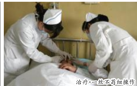
治疗·一丝不苟细操作