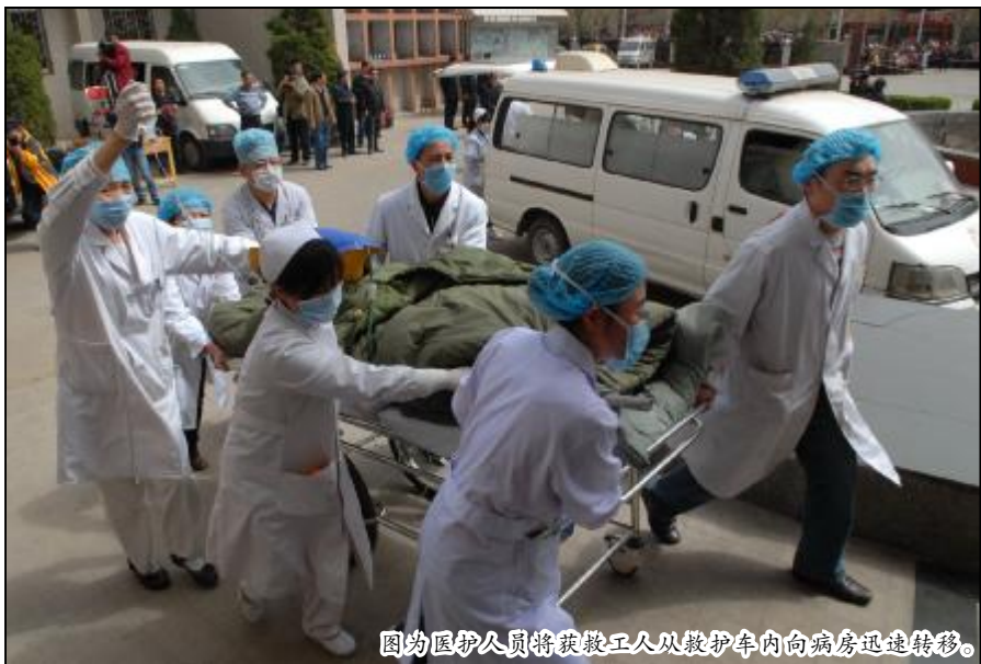
图为医护人员将获救工人从救护车内向病房迅速转移。

本报讯 3月28日13时40分，山西省王家岭煤矿发生透水事故，153名矿工被困井下。事故发生地距中铝山西企业30公