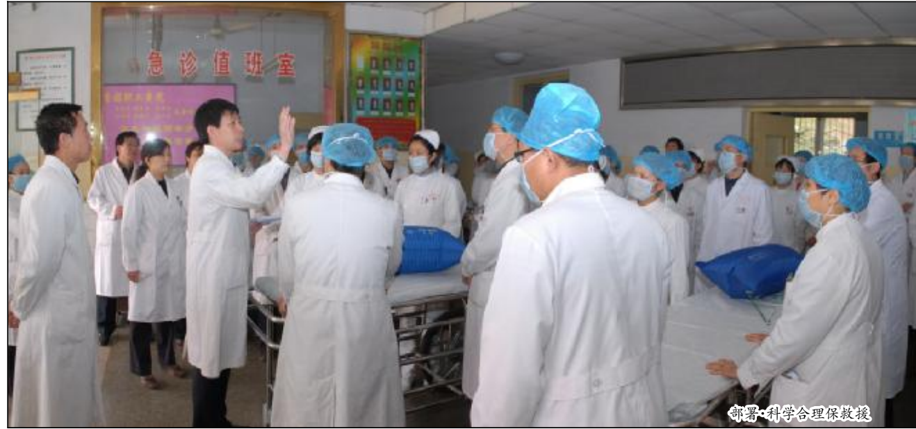
部署·科学合理保救援