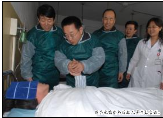
图为张鸣起与获救人员亲切交谈。

在看望慰问获救人员的过程中，张鸣起的双手始终与矿工兄弟的手紧握在一起。他说，党和政府非常关心矿工兄弟的安危，全国总工会也在第一时间参与到抢险救援工作中，看到被救矿工目前身体健康状况平稳，他感到非常高兴。他鼓励矿工一