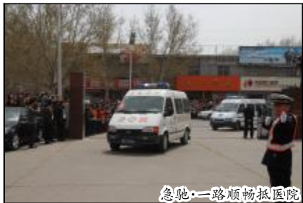
急驰·一路顺畅抵医院