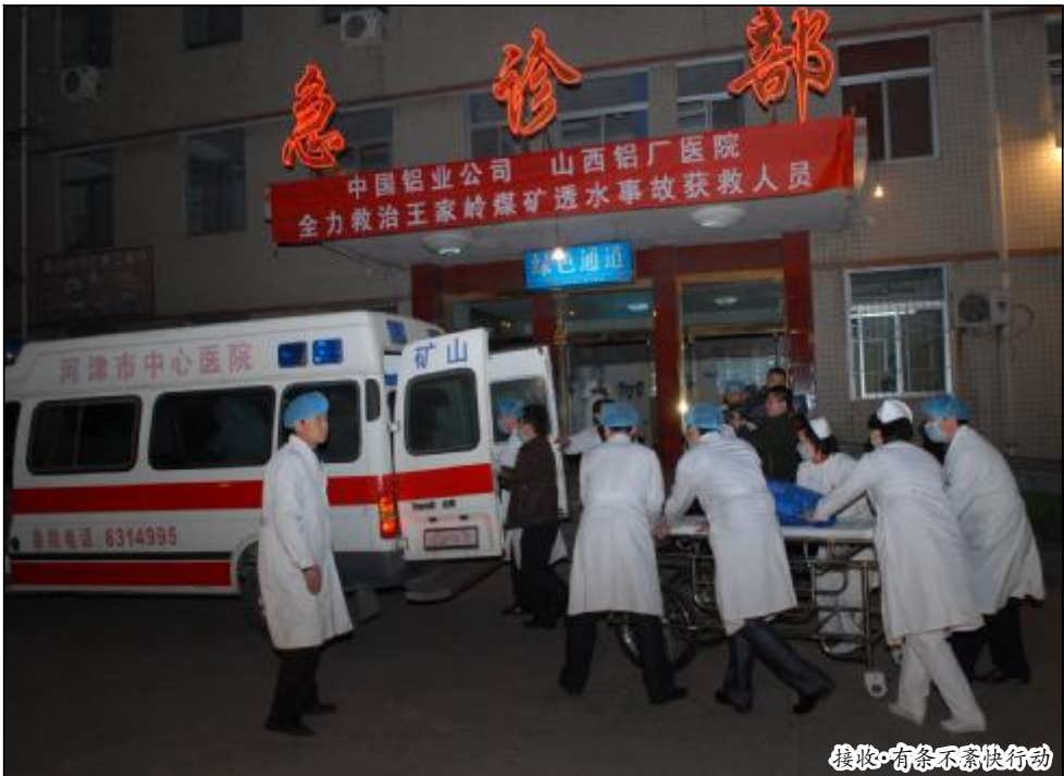
接收·有条不紊快行动