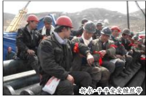
祈求·平平安安缠丝带