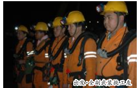
出发·全副武装救工友