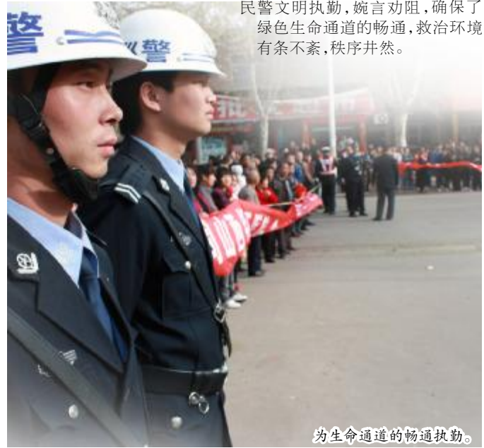
为生命通道的畅通执勤。

连日来，禹门分局干警时刻坚守在守护生命的第一线。面对心急如焚、急切想获知亲人安危的被困人员家属，面对急切要将被救矿工最新救援情况传递给外界的数十家中外媒体记者、面对手捧鲜花前来探望被救矿工的职工群众，全体民警文明执勤，婉言劝阻，确保了绿色生命通道的畅通，救治环境有条不紊，秩序井然。