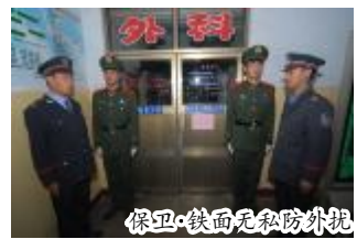
保卫·铁面无私防外扰