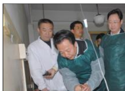
图为王君询问获救人员的病情。

在查看了其他获救人员的情况后，王君动情地说：“115名矿工升井获救，我们见证了生命的奇迹，八天八夜的持续救援，我们见证了矿难救援史上的奇迹。党中央、国务院，胡锦涛总书记、温总理对115名获救人员非常关心，要求各级党委政府全力以赴救治好伤员，我们要全面贯彻落实好总书记和总理的重要指示，把工作做好，再创造一个治疗的奇迹，保证115名矿工早日康复出院。”王君与医护人员握手话别：“相信有你们的精心治疗，他们定会早日康复。”医护人员纷纷表示：“病人早日康复是我们最大的心愿，我们绝对有信心，保证向党中央国务院，向全国人民交一份满意的答卷！”