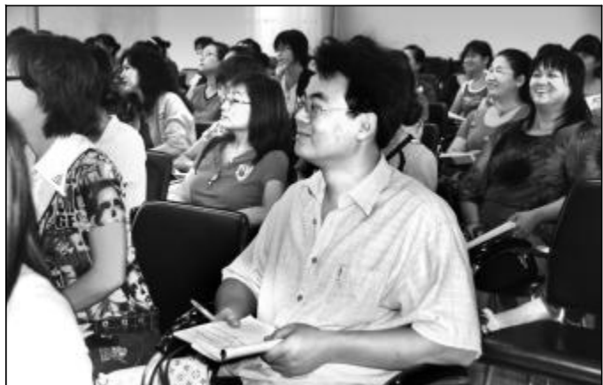
图为“阿舅”正在参加业务技能培训。(图/文 王中生)

一直以来,幼儿园老师仿佛就是女性的“专利”,“阿姨”占绝对主导地位,致使孩子的成长环境“刚气”不足。男女老师教育的互补,将使幼儿身心得到全面健康发展,更加有利于孩子的成长。