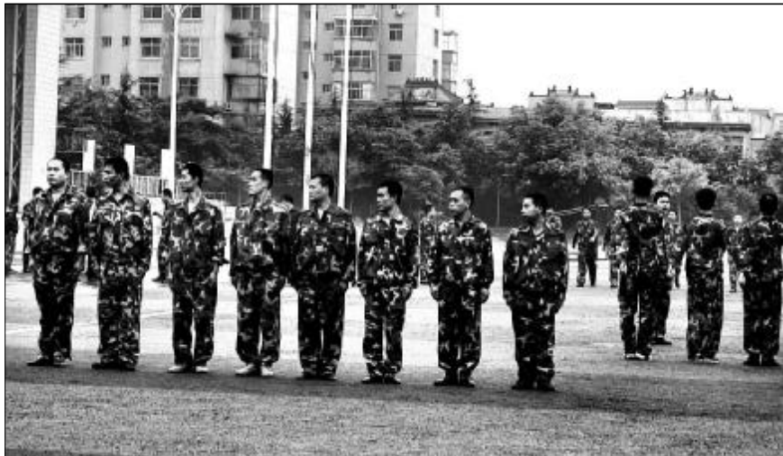
摆臂一丝不苟,步伐整齐划一,口号洪亮如钟。8月19日至26日,50名复转军人在体育场进行军训,他们是此次盘活人力资源工作中从山西分公司分流转移到武装保卫部的50名复转军人,他们表示将继续发扬部队优良传统,将好的工作作风带到新单位。

近年来,孝义铝矿小区加强物业管理,科学规划布局,栽花种树,修剪草坪,给小区职工家属提供了一个环境优美、祥和舒适的生活环境。在美化环境的同时,孝义铝矿小区实行24小时值班,坚持夜间巡逻,配置灭火器,开展消防演练,让大家住得安心;新建职工文化活动中心,安装各种体育健身器材,丰富职工业余生活,物业实行上门服务,管道修理更换随叫随到,让大家住得舒心。(刘德存)