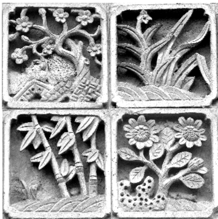
梅兰竹菊(砖雕)

在电闪雷鸣的夜晚 六岁的女儿依偎在我的怀里 一双惊恐的大眼睛 紧盯着窗外的雷雨 这是一次科普的好机会 我趁机讲述着雷电是怎样产生的 女儿似懂非懂 在闪电瞬间的光照下 眨着那双明亮的大眼睛 在电闪雷鸣的夜晚 远在舟曲汶川灾区的人民 是否也能像我们一样 住在温暖的房间酣然入睡 在洪水暴雨肆虐的地方 总有子弟兵抢险救援的身影