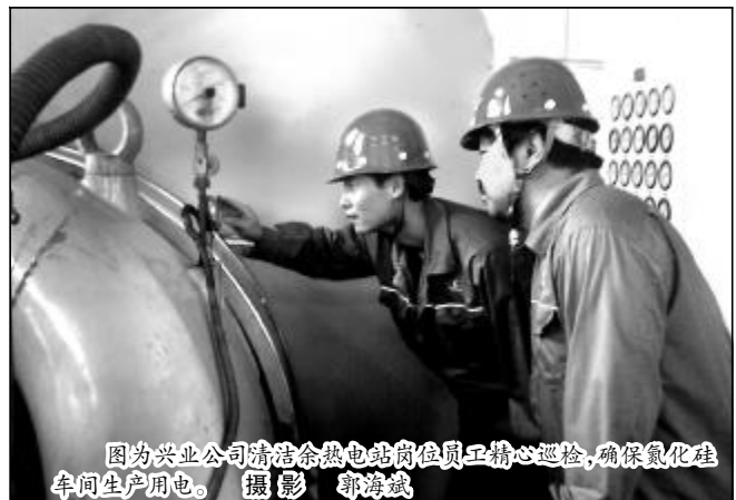
图为兴业公司清余热发电站岗位员工精心巡检,确保氮化硅车间生产用电。