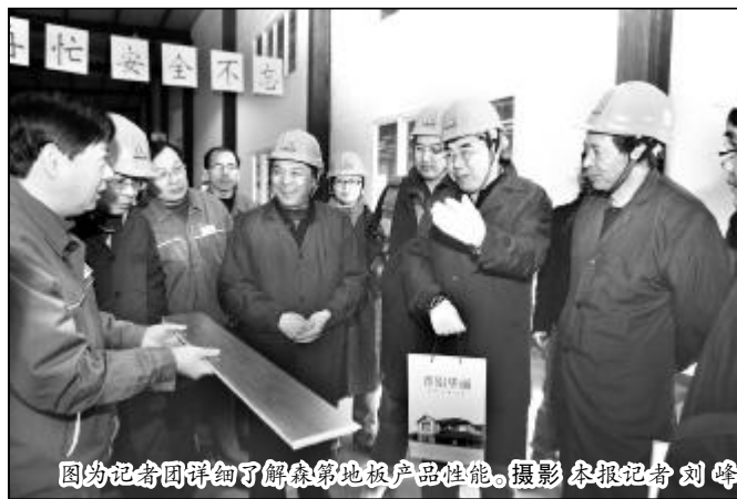
图为记者团详细了解森第地板产品性能。