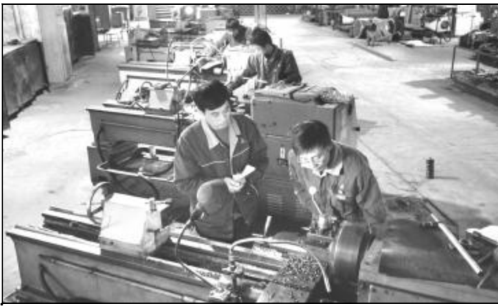
“随叫随到,人到责任到”是设备卫士的工作作风。检修分厂员工立足岗位,努力为氧化铝生产及时提供优质备件。图为机加车间员工在研究优化加工工艺,提高设备制作质量。

检修分厂进一步加强与各生产单位沟通联系,及时掌握生产单位设备运行状况,合理安排检修人员,科学组织施工,重点从五个方面采取了非常措施。强化调度指令,号召员工在关键时期更要展现出设备卫士雷厉风行“随叫随到,叫谁谁到,人到责任到”的工作作风,令行禁止,对不服从调度指令的单位和人员,按事故责任进行考核;狠抓领导值班责任制,值班领导必须到生产运行科签到,跟班作业到一线,及时解决现场发生的问题;加强生产调度信息采集,建立分厂和车间两级生产调度日报网,利用网络优势实现两级调度日报网络共享,使生产组织更及时、科学合理;强化执行力考核,要求当日晨会布置的任务当晚碰头会汇报完成情况,对完不成的单位召开事故分析会,按事故责任严格考核;确定目标责任人,对急、重、大项目确定项目第一责任人和调度责任人,明确项目目标、时间节点和考核办法。(于湘平 张安译)