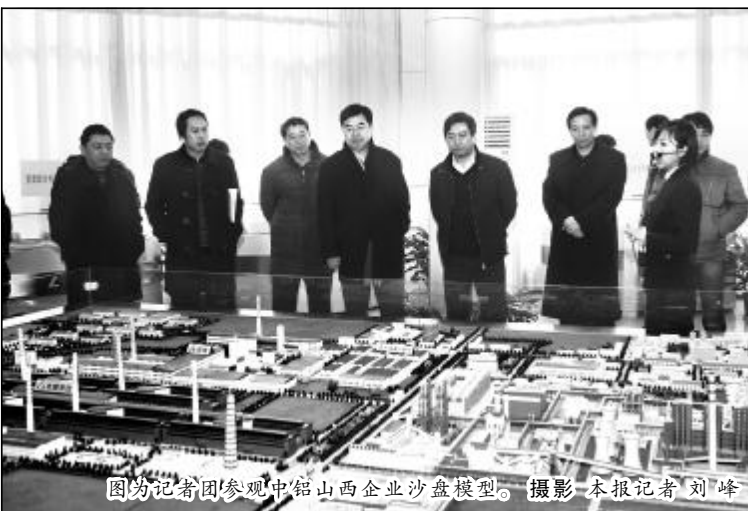
图为记者团参观中铝山西企业沙盘模型。

本报讯(记者曹小刚 实习记者李清波) 12月15日,由《光明日报》、中央人民广播电台、《财经国家周刊》、《中国经济时报》、《第一财经日报》、《新世纪周刊》、《中国有色金属报》、《中国有色金属杂志》等8家媒体记者组成的“走进中铝”记者团来中铝山西企业采访。在晋铝会议中心,中铝公司党群工作部主任袁力,山西铝厂厂长、山西分公司总经理冷正旭,山西铝厂党委书记郭顺喜以及企业有关部室负责人参加了与媒体记者的见面会。