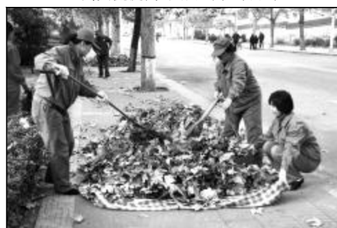
图为生活服务中心党员在奉献日里清扫落叶。

政工系统内部开展“深入基层半日活动”,经常性地、随机到基层服务,实地指导、交流各家的做法、经验,达到交流提高、共同创先争优的目的。