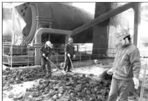
图为党员正在进行废料返流程。

在企业上下大干四季度、冲刺“红线”目标的关键时期,第一氧化铝厂党委以创先争优活动为载体,围绕控亏增盈中心任务,把解决实际问题 and 生产经营难题作为活动的重点,充分发挥18个基层党支部和533名党员的先锋模范作用,较好地凝聚了党员干部的智慧和力量,影响和带动了员工队伍。