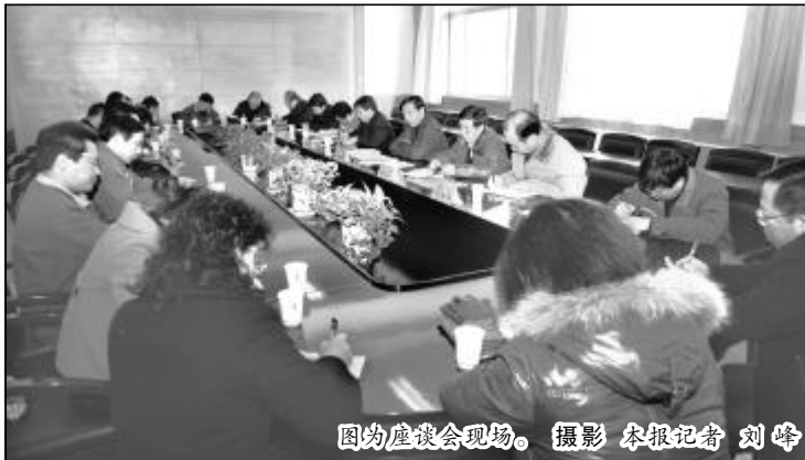
图为座谈会现场。