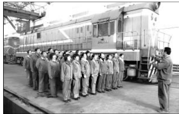
为隆重庆祝中国铝业公司成立十周年,近日,运输部在全体员工中开展多种形式的红歌传唱活动,激发员工打赢控亏增盈攻坚战的信心和决心。