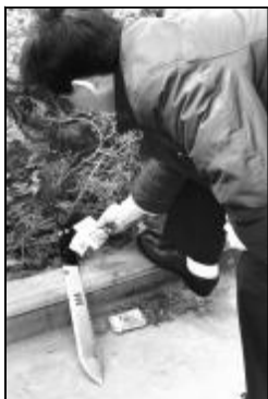
图为办案民警在绿化带提取犯罪嫌疑人的作案凶器——砍刀。