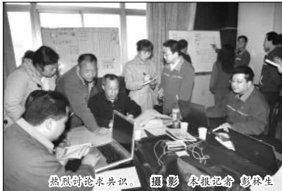
热烈讨论求共识。摄影 本报记者 彭林生

他们是开拓者——为了寻求中铝公司氧化铝企业运营转型的成功模式,为了编制一套适合于氧化铝企业运营转型的操作手册而奋力开拓;