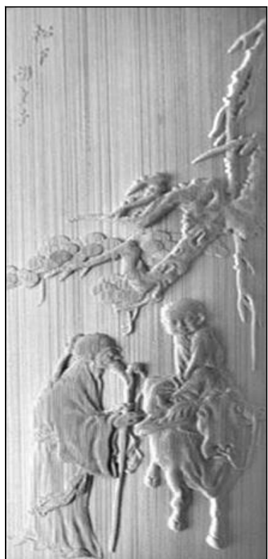
竹雕 松下问童子 薛涛

对于从厂矿长大的我来说,“故乡”的概念,可谓曾经淡薄了。真正的籍贯所在地,只能从步履匆匆的缝隙里窥其芳颜。而中条铜矿,我在那里咿呀学会第一首儿歌“矿山哪里有宝藏,哪里就是我的家”,之后度过童年,又举家迁移,在我潜藏的认知里,似乎可定义为父母曾经工作过的地方,却并非故乡。