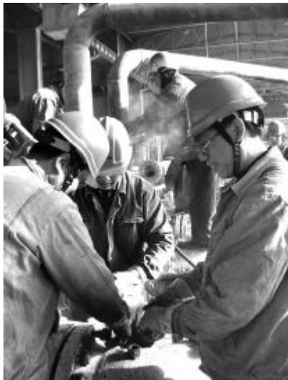
图为班组成员正在进行设备检修。

2010年,钳工二班在关于安全生产方面共提出合理化建议、技术改进项目50多条,85%的建议得到相关科室认可,其中有5条得到推广使用。班组围绕安全管理、安全隐患、职业危害、环境改善等主题,号召员工当一天安全巡查员、提一条安全生产建议、查一起事故隐患或违章行为、做一件预防安全事故的实事。用实际行动提高设备性能、降低设备故障率、保障员工生命安全,为分公司走出困境、打赢控亏增盈攻坚战作出积极贡献。