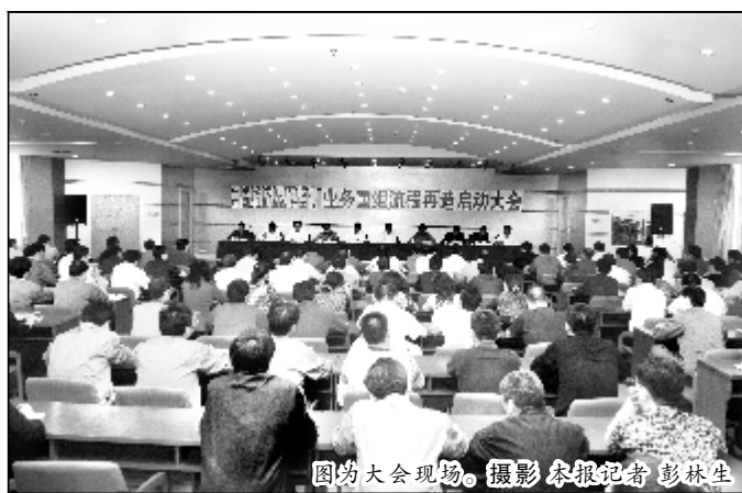
图为大会现场。

五”规划中明确提出实施“223”工程,其中,管理创新领先和科技创新领先对提升综合竞争力领先起着重要的支撑作用。实施管理创新,既是企业“十二五”规划提出的一项重要工作,也是企业六届一次“双代会”向全厂干部员工作出的重要承诺。要实现管理创新领先,就必须开展业务重组和流程再造,对已有的业务状态和流程程序展开一系列工作,通过对管理现状、机构效率、员工能力等进行分析,解决业务重叠、责任不清、多头管理、低效紊乱的局面,对影响工作效率的要素进行精简合并,删除不创造价值的业务,把有限的资源、资金集中到创造价值的业务上去,把正确的事情办好,达到资源合理利用,流程简单高效。