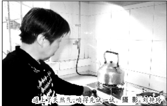
通上了天然气,咱得先试一试。

本报讯(记者张斌)4月25日10时许,家住翠微区1栋的张先生在河津鑫博天然气公司工作人员的指导下,打开新购置的天然气灶具,蓝色火焰随之绽放。在经过近一个月的紧张施工后,天然气正式走进铝