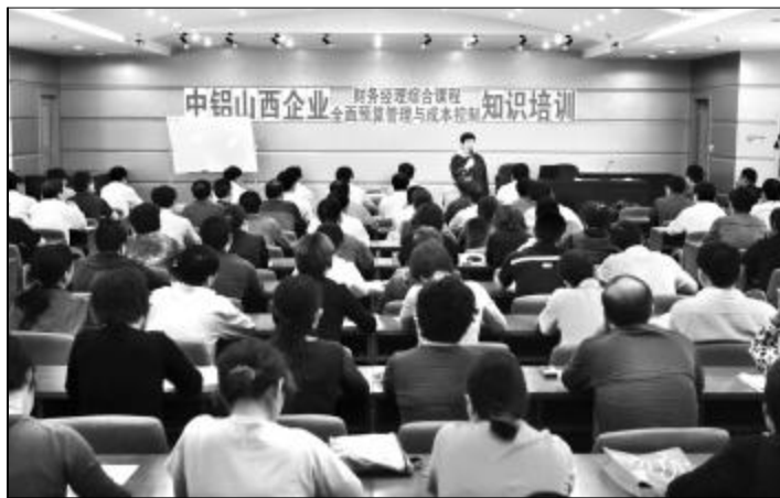
▲图为培训会现场。

5月6日上午,山西铝厂团委举办了中铝山西企业“青春聚力勇向前”青年毽球友谊赛。来自山西企业5个青年工作协作区代表队的15名毽球爱好者参加了比赛,100余名青年到现场观看并加油助威。赛场上,运动员们动作轻盈、技艺娴熟,小小的毽球上下翻飞,犹如彩蝶在空中翩翩飞舞。观众席上,呐喊声、加油声此起彼伏,参赛选手们精彩的比赛博得了观众的阵阵掌声。经过激烈角逐,第三青年工作协作区代表队获得第一名。