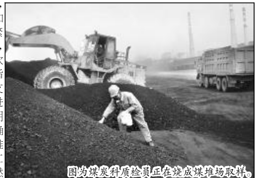
图为煤炭科质检员正在煤堆场取样。

料检验科煤场检验员作为一线监督人员,更是常年守在煤堆现场,无论刮风下雨、严寒酷暑,每天要完成数百车煤炭检验收煤任务,中午在现场简单吃顿饭,顾不上休息马上又披挂上阵,晚上还要加班至零点查收直供煤。尽管如此,中心没有一人叫苦喊累,大家以严把分公司进煤质量关为己任,始终保持一种虽苦犹乐、虽苦犹乐的乐观心态。碰到质量不合格或煤炭里有掺杂物,那更是逃不过他们的“火眼金睛”。正是通过大家的齐心协力,从市场采购、价格分析到检验控制各环节的密切配合,不仅确保了煤炭保质增量供应任务的圆满完成,而且为深入挖潜摸索出了一套管理模式。