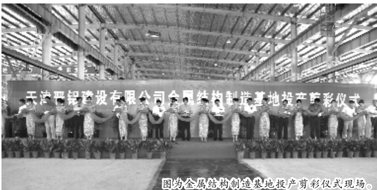
图为金属结构制造基地投产剪彩仪式现场。