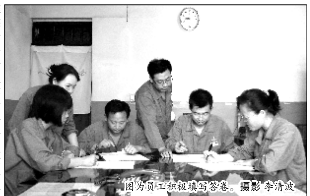
图为员工积极填写答卷。

为深入推进违章行为综合治理年活动,把安全法律法规和生产知识送到班组生产岗位,第二氧化铝厂结合“全国安全生产月”各项安全活动,以黑板报、安全横幅和宣传板面为阵地,以安全