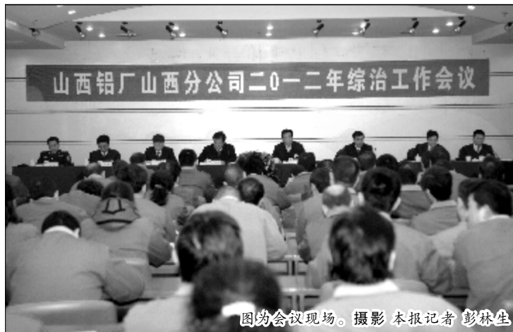
图为会议现场。

就做好2012年综合治理工作,他指出,要充分认识到综治工作面临的挑战和使命,增强做好综治工作的使命感和责任感,深入推进综合治理防控体系建设,进一步明确治安保卫责任,加强内部防护设施建设,建立完善常态演练和应急联动机制,巩固群防群治的良好局面,加强矛盾纠纷的排查化解工作,更加有效地发挥社会管理综合治理的合力,确保“两会”期间企业的和谐稳定。