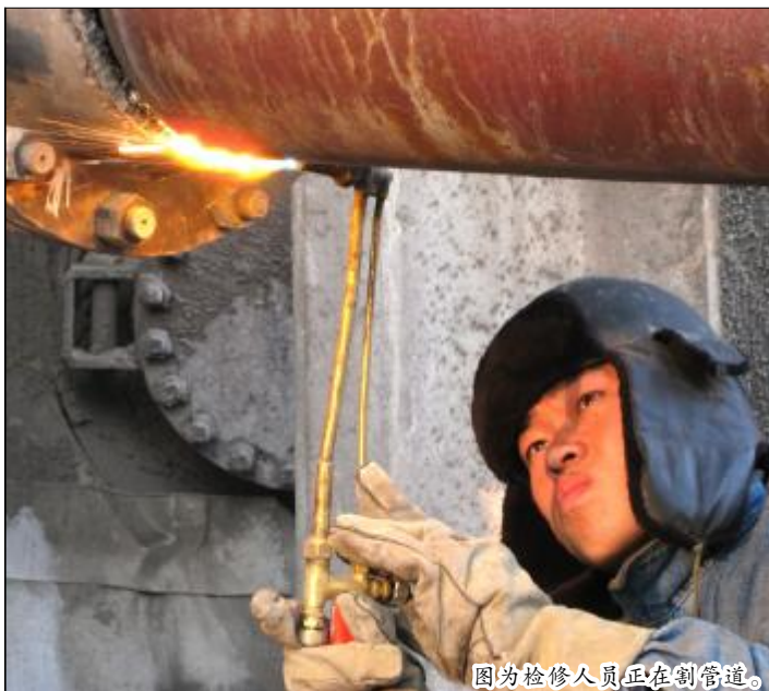
图为检修人员正在割管道。