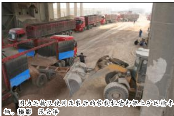
图为运输队使用改装后的装载机清卸铝土矿运输车辆。

会后,马达卡一行实地查看了氧化铝挖潜改造项目赤泥沉降分离洗涤、种子分解、高压溶出、母液蒸发建设现场。