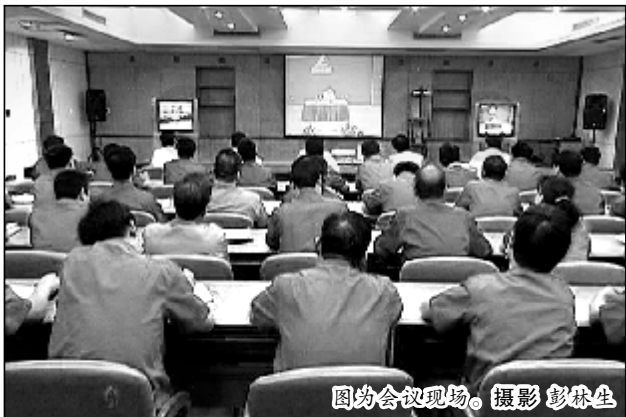
图为会议现场。

讲座历时两个半小时,刘伟教授围绕当前中国的宏观经济问题,以《中国现阶段宏观经济政策的变化与政策效应》为题,从中国经济面临的机遇和挑战、我国经济增长达到的水平、我国经济发展的特点、当前的主要矛盾、中国宏观经济政策调整