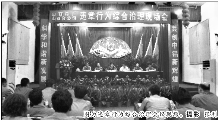
图为违章行为综合治理会议现场。

山西企业开展运营转型以来,山西铝厂团委通过开展运营转型视频短片大赛,举办专题报告会等多种方式,进一步激发了团员青年参与运营转型的热情,促进了运营转型在广大团员青年中的普及和推广,为广大团员青年主动参与运营转型打下了坚实的基础。(樊海靖)