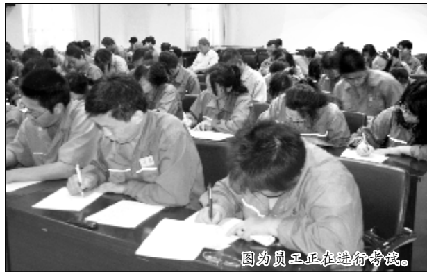
图为员工正在进行考试。

本报讯 6月28日,生活服务中心组织近百名员工进行了《习惯性违章手册》集中考试,旨在对中心汇编的《习惯性违章手册》学、背、用的实际掌握情况进行检查、验收,此项活动将“安全月”系列活动推向