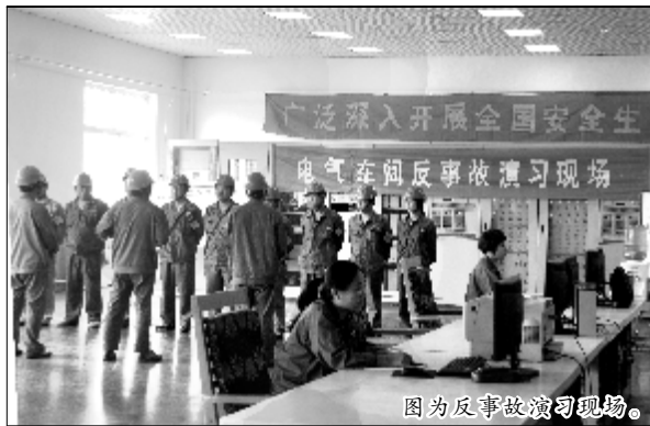
图为反事故演习现场。

6月份,中铝山西企业各单位纷纷开展了安全演讲、安全漫画展、灭火消防演练等一系列安全活动,使大家在“安全月”上了一节又一节重要的安全教育课。作为一名生产一线工人,安全无时无刻不在我们身边,有时,一个小小的失误,就会造成不可避免的损失。现在,我给大家说一说发生在我身上的一个安全小故事,希望大家能从我的故事中接受教训,安全工作每一天。