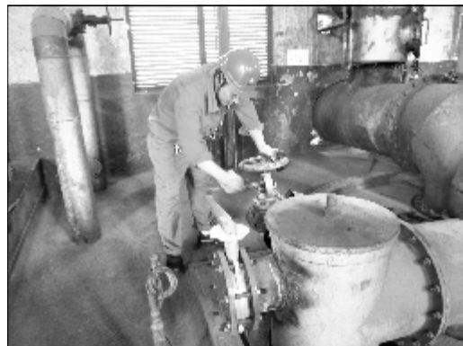
近日,热电厂造气车间克服“桑拿天”给煤气发生炉操作带来的不利影响,对备用设备进行试车演练,车间员工精心操作,严控技术参数,严把煤气质量关,已做好增开煤气发生炉的相关准备。图为员工正在操作煤气发生炉炉门。

第一氧化铝厂分解车间党支部将创先争优活动融入到生产管理、运营转型、特色活动中,有力地促进了党员作用的发挥和车间管理水平的提高,荣获分厂“党群工作流动红旗”,被分厂评为“先进党支部”,4名党员被评为“优秀共产党员”。