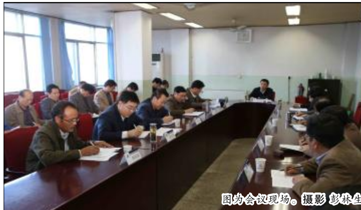
图为会议现场。