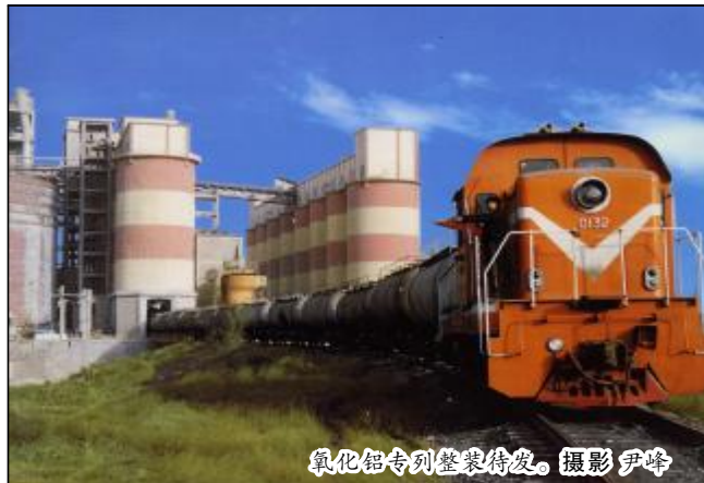
氧化铝专列整装待发。

本报讯 截止10月30日,运输部累计完成氧化铝产品发运9.6万吨,其中铝氧罐车706车,敞车785车,按时完成产品发运会指令计划。