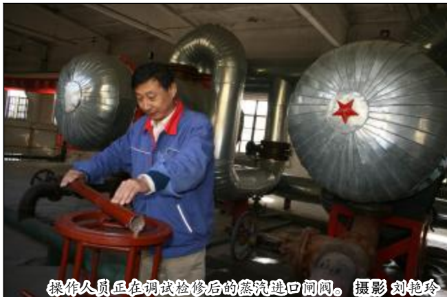
操作人员正在调试检修后的蒸汽进口阀门。

“今天,你‘消费’了吗?”近段时间,这句话成了第一氧化铝厂分解车间党员之间打招呼的口头语。乍一听,还以为是在逛街购物呢,其实它是分解车间开展党员消除浪费活动的简称。