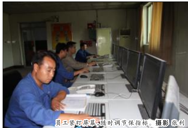
员工紧盯屏幕,随时调节保指标。