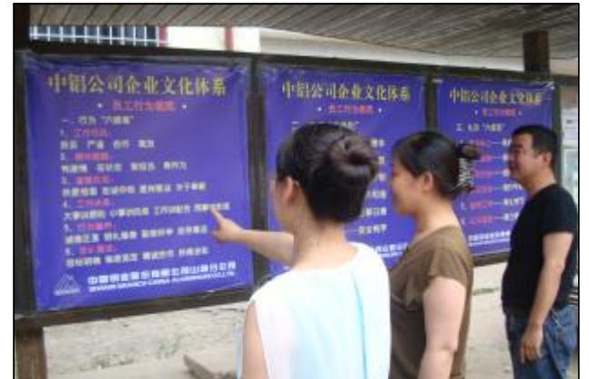
近日,孝义铝矿党委将中铝公司企业文化体系的词条印制成大幅版面,张贴于醒目的宣传栏内,为职工在闲暇时间学习和记忆提供了便利条件。