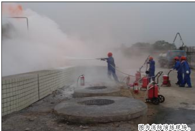
图为消防演练现场。

整个演练组织到位,紧张有序。参加演练的岗位人员和消防人员听从指挥,相互配合,动作到位。通过演练,使全体员工在身临其境的现场演练气氛中熟悉了演练程序,做到出现火情时快速启动应急预案,正确熟练掌握消防系统的使用方法、物资的救护、防护知识,此次消防演练大大提高全体员工的安全消防技能,增强了员工安全消防意识。(原卢平)