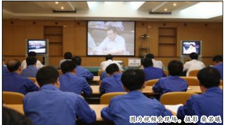
图为视频会议现场。