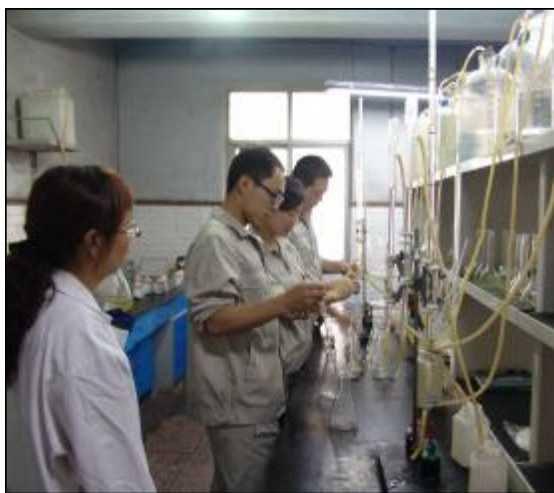
近日,由技术中心承揽的华兴铝业化验分析人员技术指导进入实际操作环节。共有40名华兴铝业培训化验分析人员通过前期岗前安全教育、专业理论培训、理论考试测评,被统一安排到理化分析、质量检测等岗位进行实战演练。图为技术中心高级技师正在为华兴铝业员工进行实际操作培训。

《这样工作最出色》这本书,我每天都抽出一点时间来读,书中关于如何工作的中肯观点,关于人生的精辟见解,使我得到启迪,受益匪浅。