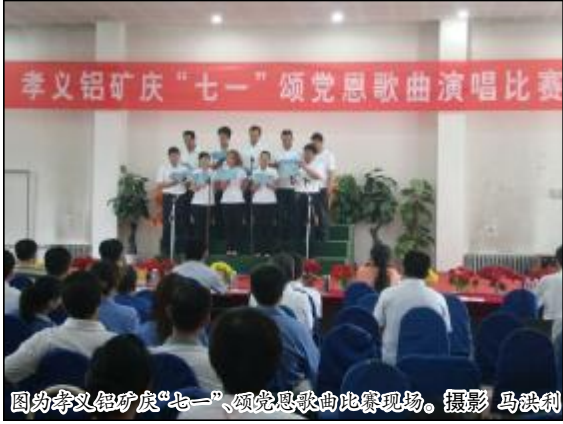
图为孝义铝矿“七一”颂党恩歌曲演唱比赛现场。

6月25日，运输部召开纪念建党 92 周年大会，对“运营转型创佳绩，党建管理上水平”专项工作中涌现出的 10 名优秀共产党员和 10 名生产标兵先进进行隆重表彰，要求各支部认清形势，勇于迎接挑战，鼓足干劲完成下半年生产经营任务目标；立足“大党建”工作格局和思路，紧紧围绕本单位的重点难点工作，用过硬的方法和措施解决存在的实实在在的问题；党员领导严格