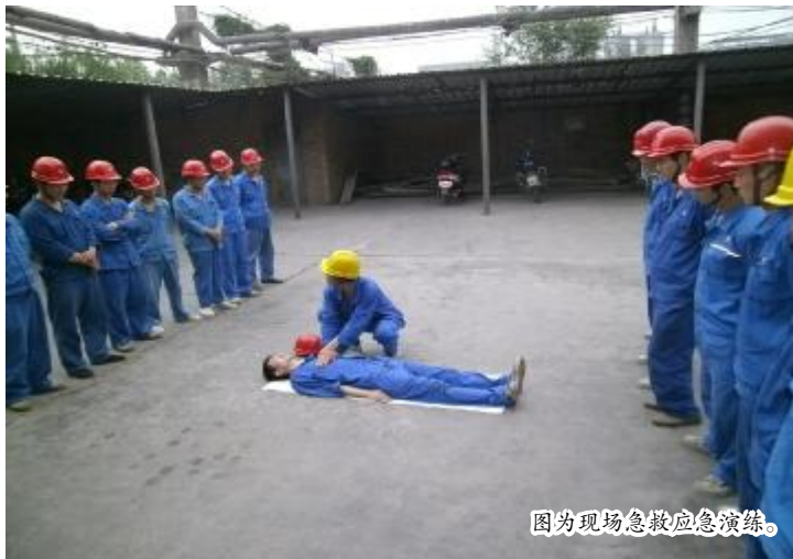
图为现场急救应急演练。