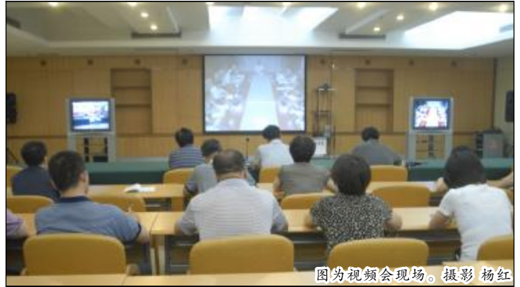
图为视频会议现场。