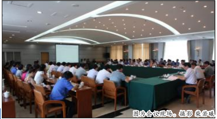
图为会议现场。