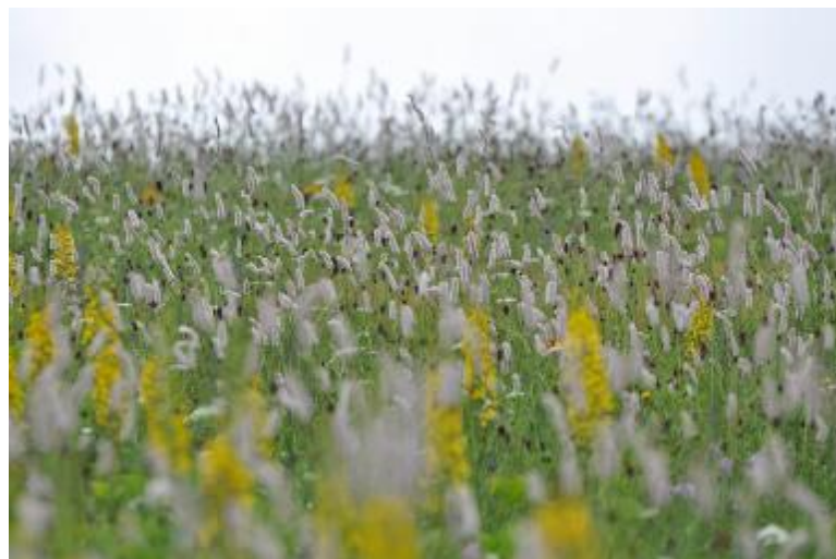
星星点点

细雨如丝,夜色如梦,拉长躲在心底无边的念想。在雨中浸润、滋长。雨,无声,念,无声。雨,无形,念,无声。