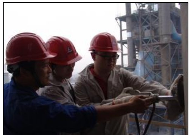
近日,华兴铝业47名员工在山西分公司圆满完成分析、测定等岗位技术培训,全部学成返厂。图为技术中心工艺研究室测定技术人员在焙烧炉现场对华兴铝业测定工进行烟尘测试技术培训。

企业新闻宣传工作是企业思想政治工作的重要组成部分,肩负着统一思想、宣传主张、教育引导、推动工作的重要职责,在促进企业科学发展中发挥着无可替代的作用,特别是在当前复杂多变的国际经济形势下,进一步做好企业新闻宣传工作,为推进企业实现良性发展提供强大的精神动力,具有十分重要的意义。