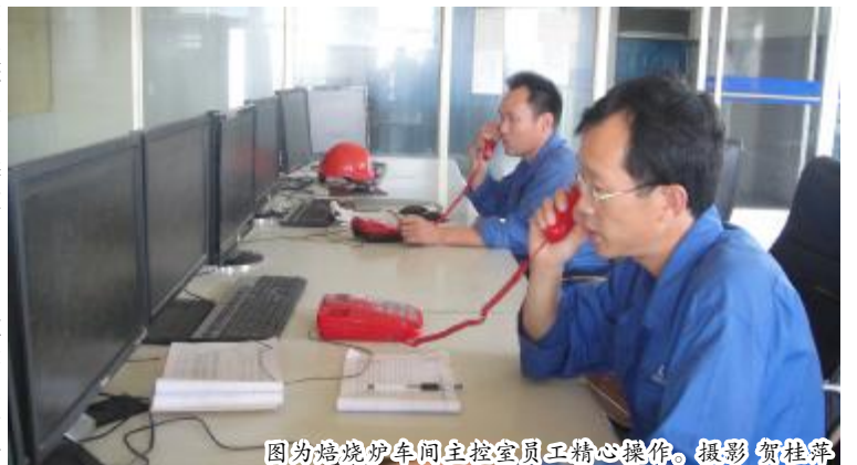
图为焙烧炉车间主控室员工精心操作。