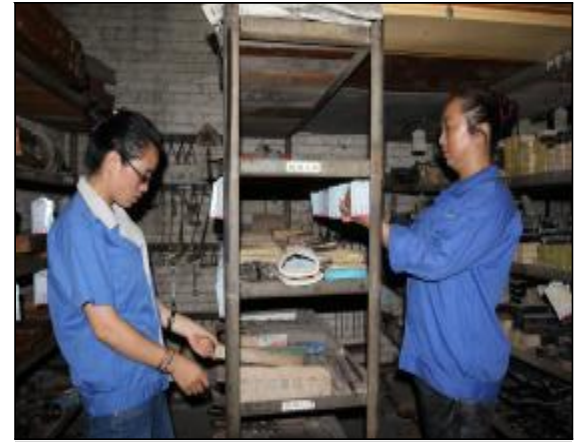
近日,晋铝建安公司机加车间库房管理人员提出对库房分批整改、分块完善方案。机加车间作为机械加工场地,备件材料出入库量大、种类繁多,机加车间将夯实基础管理与专业管理提升相结合,对钢材货架和借用工具货架进行详细分类、明确标识,节省了取用工具时间,有效提高了工作效率。图为车间库房管理人员按照标示牌领取备品备件。

重行动促制度落实。由企业党委统一安排,纪检、组织、人事部门联合组成检查组,通过查看记录、问卷调查、个别谈话、党组织自查、企业中层干部自查承诺等多种方式,进行作风建设专项检查。在改进会风方面,压缩会议次数,控制会议时间,能合并召开的会议合并召开,会议效率和会议质量不断提高。在勤俭节约方面,充分利用企业综合信息平台,推行无纸化办公;企业与中铝内部兄弟单位、上级部门之间,企业内部各单位、各部室之间做到了不相互请客;在廉洁作风方面,各单位加强了对公车的管理,严格控制招待费用,认真执行操办婚丧嫁娶等事宜规定,有效防止了公车私用、公款吃喝及借机敛财等行为,得到了员工群众的拥护和认可。(杨青)