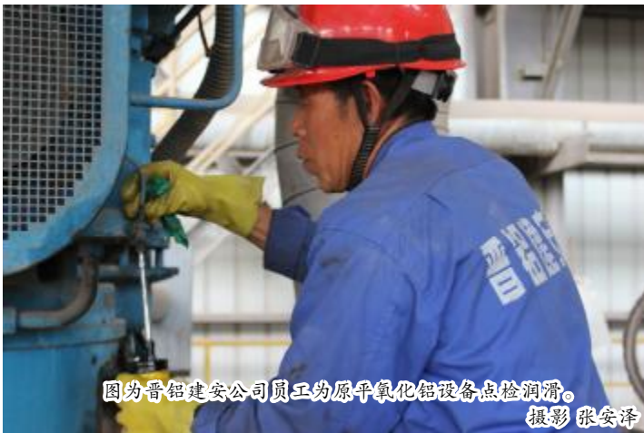
图为晋铝建安公司员工为原平氧化铝设备点检润滑。