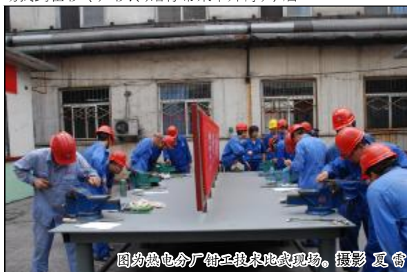
图为热电厂钳工技术比武现场。

截止8月底,热电厂各车间共开展岗位培训、练兵、竞赛110余次,参与员工多达2400余人次,为热电厂生产经营和降本增效工作提供了坚实的人才支撑。