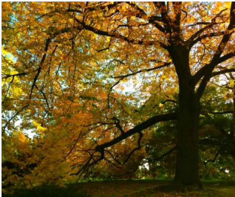
金秋色正浓

大河一定能比我听到更多的声音，七星瓢虫的私语，搬运粮食的黑蚂蚁长队的嘿咻嘿咻声，柿子花凋落了，大树弯下腰拾起花的梦境，经过一个春秋的艰苦修行，终于