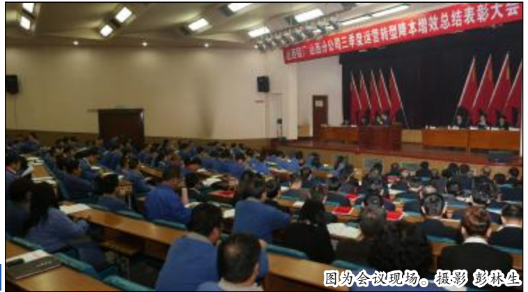
图为会议现场。