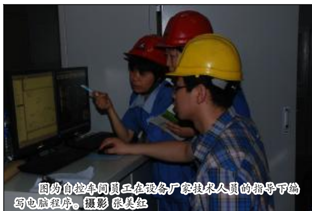
图为自控车间员工在设备厂家技术人员的指导下编写电脑程序。