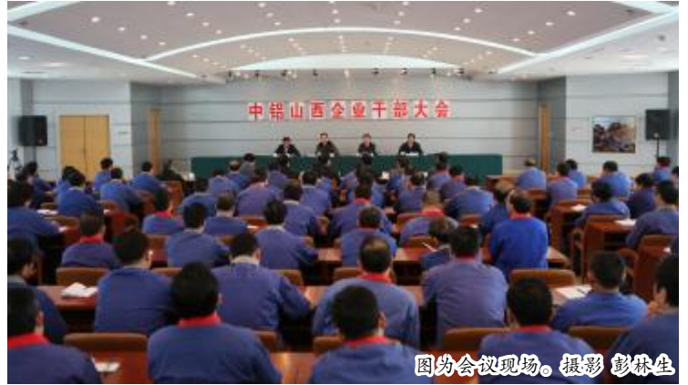
图约会议现场。