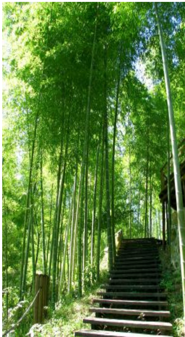
竹韵 摄影 卫志毅