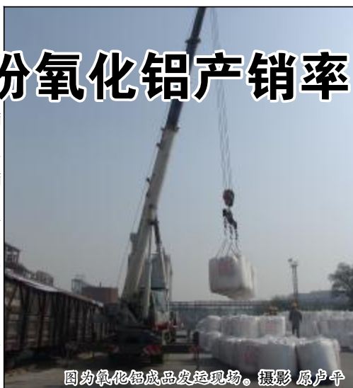
图为氧化铝成品发运现场。