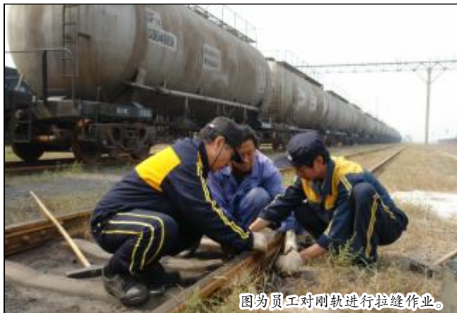
图为员工对刚轨进行拉缝作业。