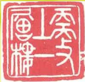
更上一层楼 篆刻 卢梓

梦纯真，花最美。一往情深，“编”“作”终无悔。书画诗言情似水；点滴融魂，揉进心滋味。