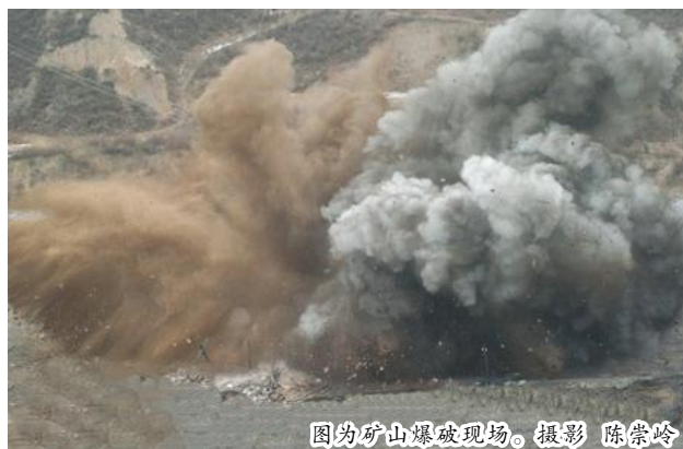
图为矿山爆破现场。

在海拔八百多米的矿山开采阶梯上,均匀而规整地排列着上百个碗口大小的孔洞,这些是根据实际矿层要求,经过反复测量,用钻孔设备事先钻出的爆破孔。通过往十几米深的爆破孔里埋放炸药,实现对岩层的松动爆破,让整个矿层变得疏松,以便挖掘机的开采,继而源源不断地输送至氧化铝厂区。