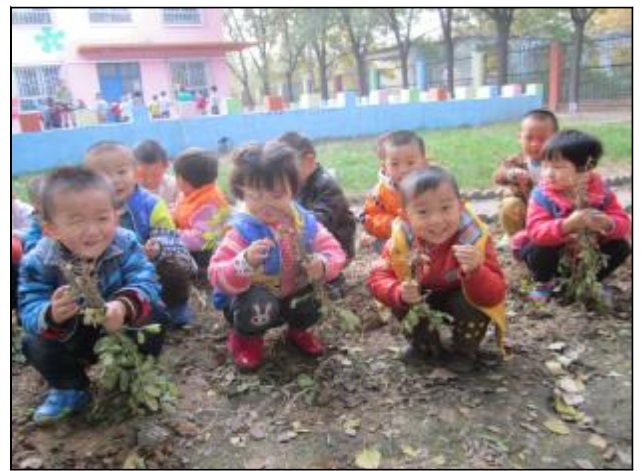
花生的营养价值极高,它是怎样成长的呢?生活服务中心毓秀幼儿园的孩子们在经过了春天的播种,夏天的耕耘,通过长期的观察与管理,经历漫长的等待与期盼,终于等到了收获的这一天。11月初,幼儿园老师带领小朋友们一起收花生,孩子们好开心哦!

实业总公司新班子成立后,立即对各支部进行了党群工作调研。通过充分摸底,优化党委运营转型项目,并把抓好党员消除浪费改善点作为突破口,形成了项目牵引、课题支撑、党员带头、全员参与、消除浪费、持续改进的联动局面。3个多月来,4名党委委员每人挂沟2个支部,坚持每周深入生产经营一线解决疑难问题;在岗67名党员结合实际确立消除浪费改善点30个,月均创收节支近3万元;上报小建议、金点子39条。在三季度累计减亏63万元后,10月份一举盈利21.35万元。(石大为)