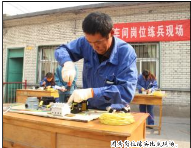
图为岗位练兵比武现场。

2013年,中铝山西企业从人才储备角度开展了重点岗位人员的学习培训;从业务技能提高角度开展了岗位人员的学习培训;从一专多能、一岗多能角度开展了相关人员第二工种的学习培训。通过三个类型的学习培训,特别是通过开展“三大”规程的学习,实现参与人员多,与生产经营结合紧密,便于练兵、竞赛和评价考核,取得了较好的效果,提升了员工队伍整体的技能素质,岗位员工操作水平得到有效改善。