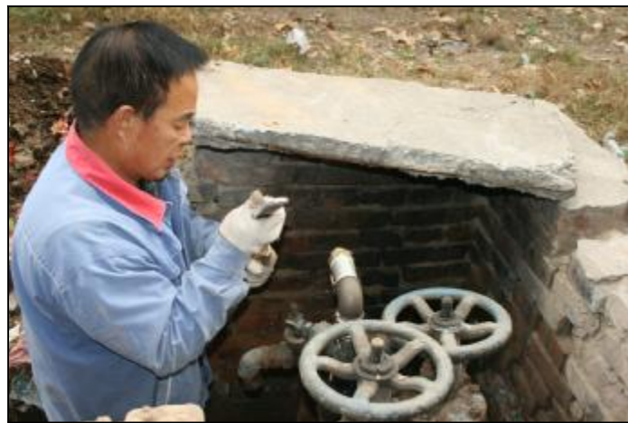
自11月15日生活区供暖全面开始后, 生活服务中心根据供暖循环情况, 在生活区分设16个片, 对有代表性位置的48户居民室内温度进行监测, 随时掌握供暖实际情况, 作为系统调整的依据参数。目前, 生活区的三个热交换站热运行系统均在进一步调试当中, 维修车间组织人员正在针对居民家中暖气不热现象加班加点抢修。