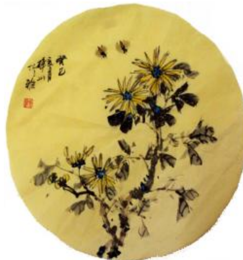
菊花扇面 国画 郭学斌