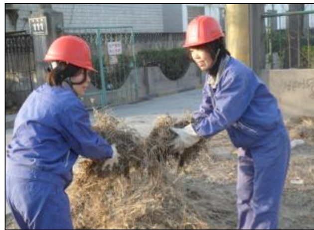
水电分厂一车间地处5号路中段,针对车间门口绿化区的枯草冬季极易引起火灾这一问题,近日,车间多次组织员工对绿化区的枯草、杂物进行清理,落实冬季五防工作,做到安全文明生产。图为员工正在清理杂草。

近段时间以来,文明检修已在分解车间蔚然成风。车间严格落实精细化管理、规范化作业的检修标准,大力推进检修标准化管理和安全文明施工,实行全方位、全过程的检修控制,杜绝野蛮检修,以措施抓过程,以管控促提升,有力促进了检修质量和安全文明水平的提高,检修人员的文明意识不断增强。检修现场严格落实“三净”:开工场地净、检修场地净、完工场地净。拆卸下来的零部件、工器具清洗干净,分类定置摆放。检修现场安全设施、警示标志齐全明显。检修工作程序化、规范化、标准化,淋漓尽致地体现在每一个检修工序、每一块警示标识和每一个检修现场。