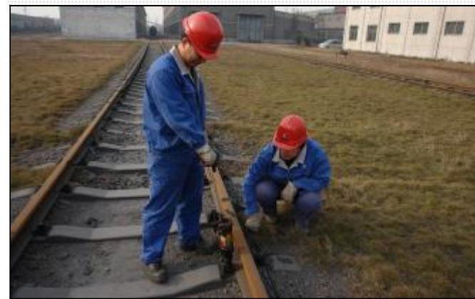
近日,运输部员工铁路安全专项整治中,利用饮料瓶、海绵、万能胶制作了润滑加油装置,有效控制废机油灌注量,提高了钢轨内外螺栓润滑效果,延长钢轨螺栓使用寿命 20% 至 30%。