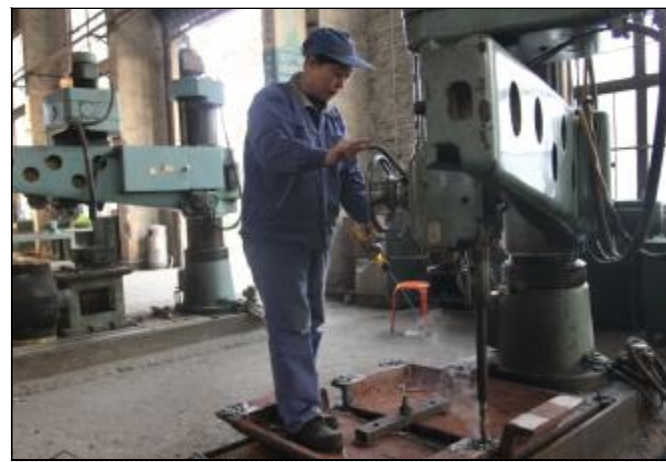
近日,晋铝建安公司机加车间根据检修需求,对板式给料机链板部件和蒸发器管板进行赶制,面对备件工艺要求高、材质加工难度大等困难,操作人员在模具设计制作、铸造、加工、质检等环节中严格执行操作规程和质量规定,满足生产单位需求。图为操作人员对链板进行润滑降温。