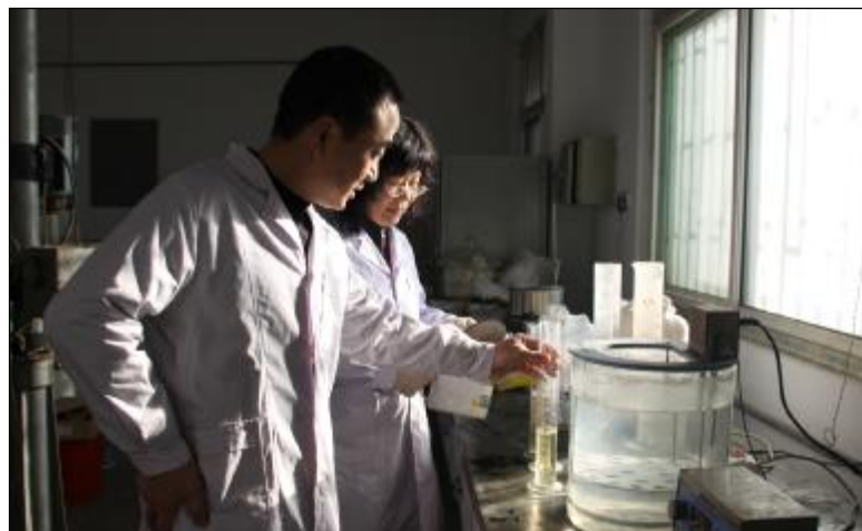
近日,技术中心应用研究室大力开展增收创收试验项目。试验小组成员,牺牲节假日休息时间,每天工作14个小时以上,加班加点,精心试验。目前,“沁源矿四个矿点的溶出性能试验”项目中各种溶出、沉降条件优选试验和阶段性试验数据的整理分析工作已经完成,为下一阶段试验奠定良好的基础。