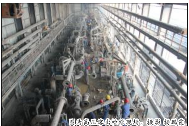
图为高压溶出检修现场。

“每一次倒组,我们二三百名的检修人员就集结在氧化铝厂高压溶出生产现场,(下转第二版)