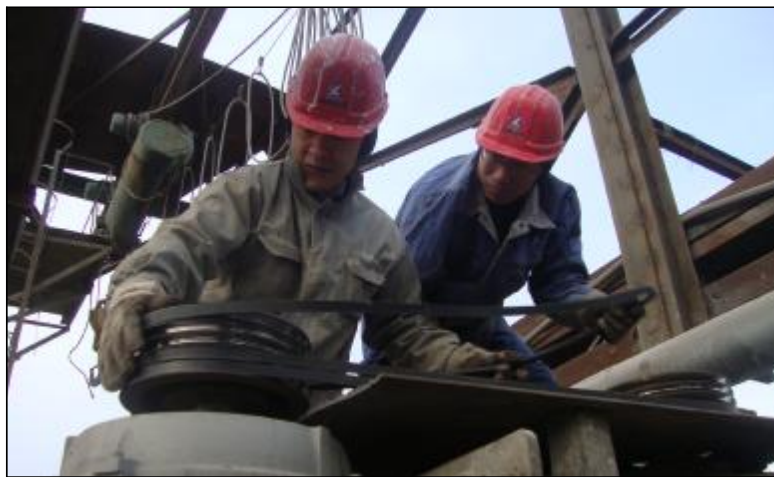
日前,第一氧化铝厂开展重点设备分槽新年首次的季度普查,技术人员对32台分槽逐一进行“望闻问切”。此次普查共处理隐患41项,更换皮带19台,处理电器隐患2个,为首季稳定生产铺好了绿色通道,为营造祥和安全的节日创造了良好的条件。

该段结合当前线路设备检修作业特点、节前安全检查等重点工作,对重点设备实行分片包干,细化全员培训计划,大力开展“学规程、用安规、反三违”活动,提升全员现场作业安全意识。同时对大轨缝、信号无法开放、钢轨磨损超限及道床污染严重等问题重点整治,提高行车运转率,确保冬季线路设备运用良好。该段细化完善断轨、除雪打冰、设备故障等应急处置预案,强化三级应急管理,密切监控管内天气状况和设备状态,做到人员24小时值守,保证运输安全畅通。(丁剑锋 卢建军)