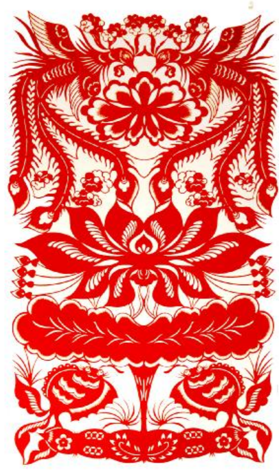
风起祥瑞 剪纸 刘芸