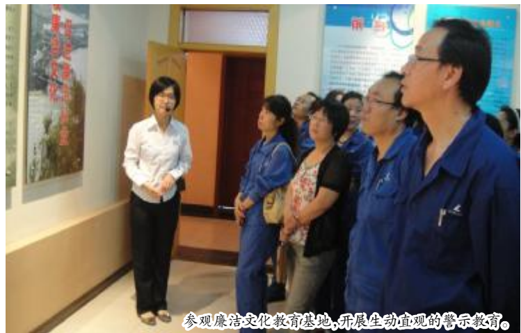
参观廉洁文化教育基地,开展生动直观的警示教育。

(一)建立完善作风建设相关制度。先后出台了《中铝山西企业关于进一步改进作风的意见(试行)》和《中铝山西企业关于进一步改进工作作风密切联系群众的具体措施》,对企业改进调研工作、精简会议、提升文件简报质量、改进新闻宣传工作、加强廉洁作风建设、厉行勤俭节约、树立服务意识等七方面做出详细规定,企业所属各单位参照企业对处级干部的规定,规范了科级干部操办婚丧嫁娶等事宜;结合本单位实际,修订完善了公车使用管理规定、公务接待规定等,制定了改进作风的具体措施。