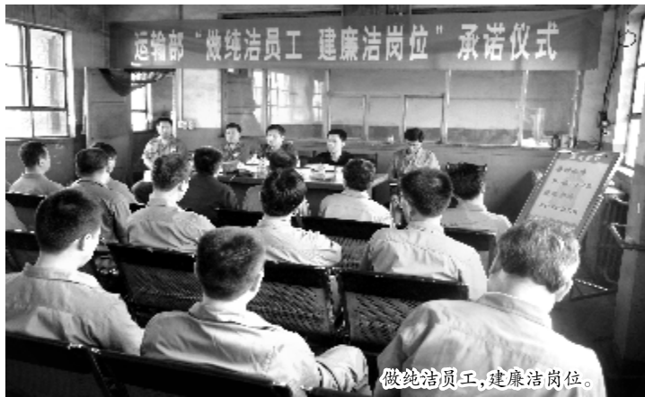
做廉洁员工，建廉洁岗位。

同志们，让我们在企业党政班子的坚强领导下，全面贯彻中央纪委三次全会精神和中铝公司党风和反腐倡廉建设部署，以踏石留印、抓铁有痕的劲头履职尽责，以持之以恒、锲而不舍的精神敢作敢为善做善成，不断推动党风和反腐倡廉建设取得新成效，为企业持续提升竞争力提供有力保障。