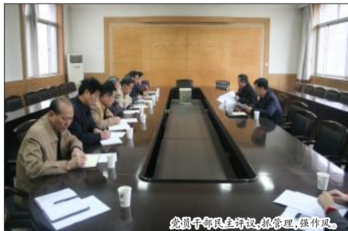
党员干部民主评议,抓管理,强作风。

按照“打铁还得自身硬”的要求,不断加强监督人员队伍建设,对监督人员严格要求、严格管理,特别强调纪检监察干部要严格遵守办案工作纪律和工作制度,严格依法依规查办案件,带头执行作风建设有关规定。根据总部统一安排,开展了纪检监察系统会员卡清退工作,94名纪检监察干部递交了“零持有”报告。企业纪检监察审计部门积极投入到运营转型、CBS模块构建及“运营转型创佳绩、党建管理上水平”专项工作中,用运营转型的理念、工具和方法,梳理工作制度,完善业务流程,促进专业管理水平不断提升;以队伍建设为改善课题,优化组织结构,细化工作职责,改进工作方式,强化岗位培训,纪检监察人员队伍建设取得新进展。