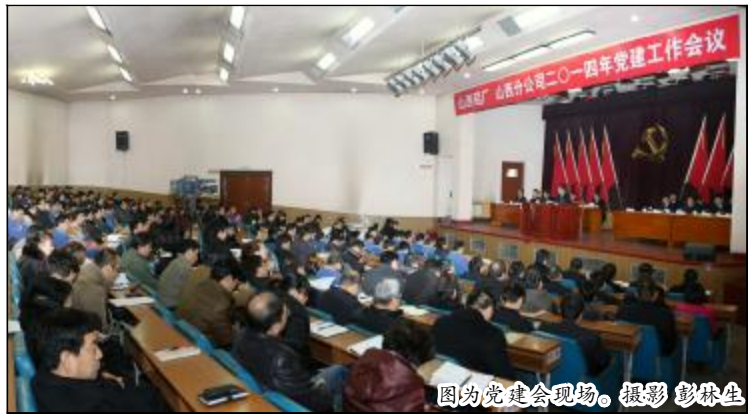
图为党建会现场。