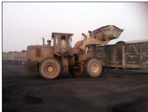
面对大量的矿石储运任务,晋铝建安公司运输队精心组织人员,合理调配车辆,连续24小时不间断作业截至2月18日,共联运矿石1364车,计34100吨;烧成煤装车皮448节,计26880吨,有力地保证了分公司生产所需大宗原燃物料的装卸、运输任务的完成。