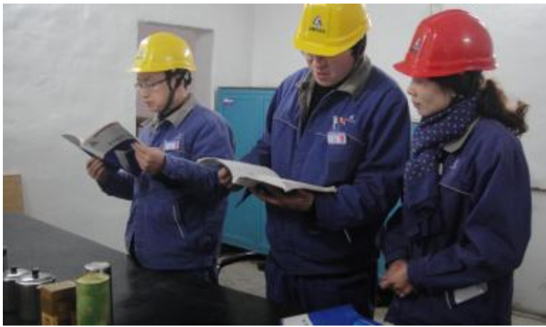
近日,第二氧化铝厂综合车间采取强力措施,狠抓日常基础管理。车间组织专门人员对设备设施、安全环保、劳动纪律、班前会、交接班、点巡检制度、绩效分配公开等管理工作进行不定期的检查,特别是员工劳动纪律方面,规范上下班签到程序和中途外出手续。

2014年,修造车间将不断完善、细化、出台新的举措,实行市场化的薪酬考核分配体系,用市场化的分配和激励手段挂构考核,同时大胆走出去,发挥技术优势,努力形成稳定的利润增长点。(杨鹏震)