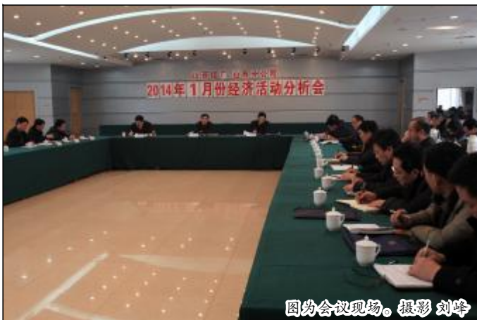
图为会议现场。

企业领导结合各自分管工作和联系单位,对元月份生产经营存在的问题进行分析,并对下一步重点工作提出具体要求。