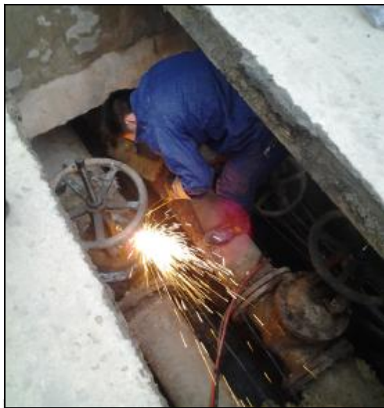
近日,龙门大道口热网大干线闸口阀门因老化脱落造成管网堵塞,翠微区、朝霞北小区出现大面积暖气不热现象。生活服务中心维修二车间第一时间组织党员突击队进行抢修,连续奋战5个小时成功修复阀门。