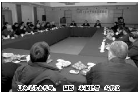
图为通报会现场。