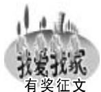
我爱我城 有奖征文

这种现象在许多人自身的意识中得不到有效提高,更别提从根本上关注节约了。试想,如果人人都这么想,看到有长流水、长明灯、螺丝钉随处可见,一张纸写不到几个字就扔掉的现象任意发生,上至前制,那今天先不说我们的环境,我们赖以存活的资源都难以维持和支持现代发展,更不用说我们的子孙后代了,我们该如何向他们交待呢?他们今后的生存资源还有多少可以利用和维持生存和发展呢?因此,要消除“事不关己”的思想,携起手来,鼓起勇气,同浪费现象做斗争,这是我们每个人应尽的责任和义务,要把它当成光荣的使命来完成。倡导节约,反对浪费,共同维护资源的合理使用,构建和谐社会。