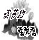
我爱我城 有奖征文