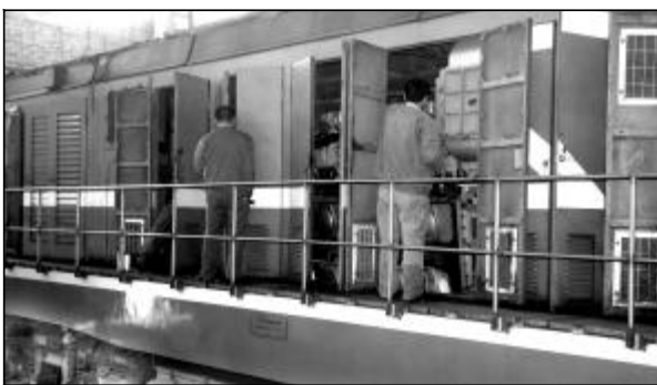
一季度,运输部机务段开展“认真做好机车检修,及时消除设备隐患,为运输生产提供优质运能”活动收效明显,机车正点出库率达100%,机故临修为零,创历史同期最好水平。图为检修人员正在对机车精检细修。

3月21日下午15时45分,氧化铝四分厂六车间沉降底流泵跳闸,引起2号沉降槽搅拌负荷重停车。此时种分槽液量已满,如果不能及时恢复运行,后果将不堪设想!