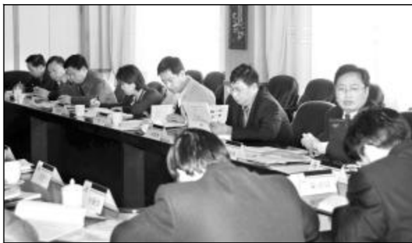
图为与会人员正在热烈讨论。