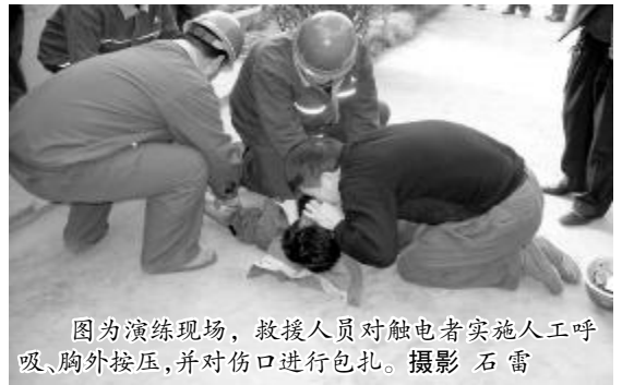
图为演练现场,救援人员对触电者实施人工呼吸、胸外按压,并对伤口进行包扎。

汇报给调度室。几分钟后,消防车急速奔向事发地点,各救护人员也拿着包扎救护品迅速赶往事故现场。整个演习过程场面逼真,秩序井然,各环节衔接紧凑,救援人员配合默契,使员工得到了一次实战锻炼。(石雷)