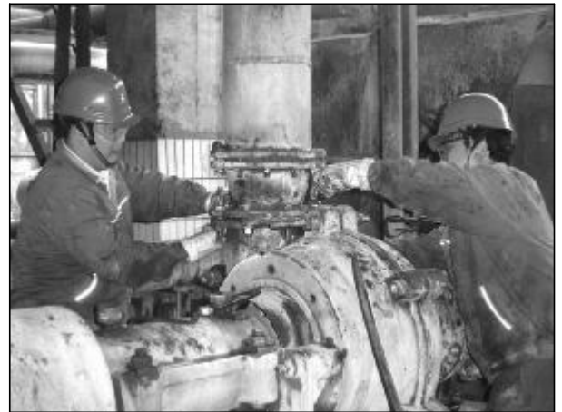
近日,氧化铝四分厂种分车间在做好设备日常点、巡检的同时,对影响生产的设备进行全面消缺。图为检修人员对3号受液泵进行检修。

交流,增强了班子的战斗力和凝聚力;通过开展“每月一活动”,扩大了员工的参与面,增强了工作活力;加大现场环境治理力度,制作了“员工穿衣镜”、人性化提示语,车间物品做到了定置摆放,实现了车间人与人之间、人与环境之间文明和谐的目标。(王晓宇)