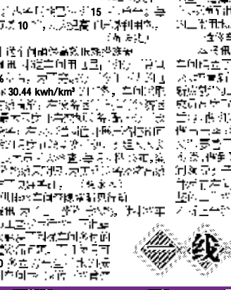
煤分分厂燃料车间收尘班女工正在操作收尘设备。