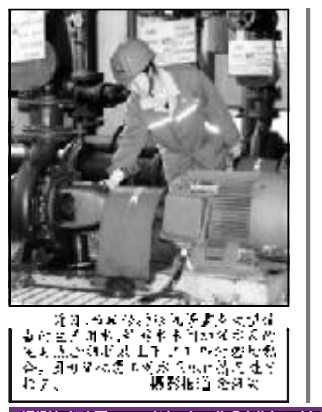
煤分分厂燃料车间收尘班女工正在操作收尘设备。

煤分分厂“娘子军” 煤分分厂燃料车间收尘班 煤分分厂燃料车间收尘班，是一支由女性组成的“娘子军”。她们在平凡的岗位上，默默奉献，为煤分分厂的安全生产做出了重要贡献。她们热爱本职工作，工作认真负责，严格遵守各项规章制度，确保了收尘工作的顺利进行。 收尘班的女工们，在工作中，不怕脏、不怕累，始终保持高昂的工作热情。她们经常加班加点，确保设备的正常运行。她们注重团队合作，互相帮助，共同攻克了多项技术难题。她们还积极参与技术创新，提出了多项合理化建议，提高了收尘工作的效率和效果。 收尘班的女工们，在生活中，也展现出了良好的精神风貌。她们热爱学习，不断提高自己的文化素质和业务水平。她们关心集体，乐于助人，为煤分分厂的和谐发展做出了积极贡献。