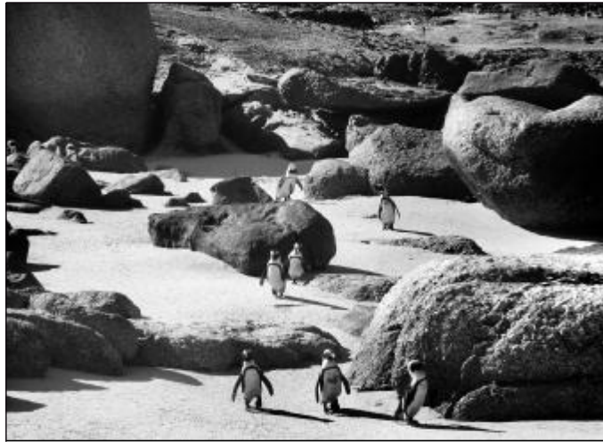
企鹅戏滩 杨璋德 山西铝厂工会