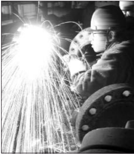
绽放金菊 邢建英 氧化铝三分厂