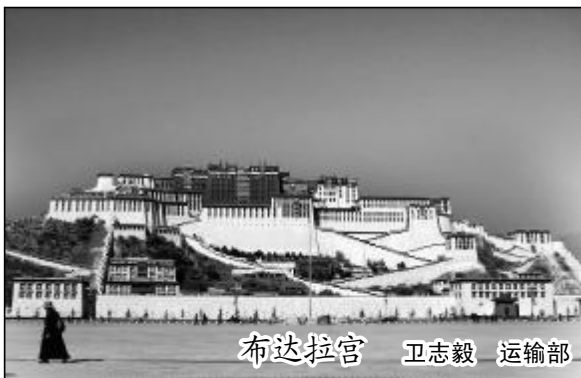
布达拉宫 卫志毅 运输部