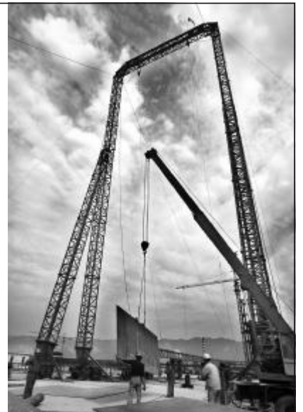
龙门吊 赵明星 科技化工公司