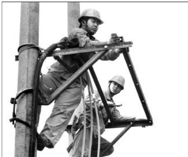
近日,水电分厂电气检修车间外线班在秋雨季节来临之前,组织员工对所辖6KV供电线路进行认真巡视检查,及时消除隐患,确保每一条供电线路稳定运行。图为班组成员在对15米高的架空线路进行隐患排查。

群众的生命财产安全,提高全民的交通安全意识和遵守交规的自觉性,在司机中形成人人增强自我保护意识,人人提高交通法制观念,人人珍视生命安全的良好氛围。(崔文林)