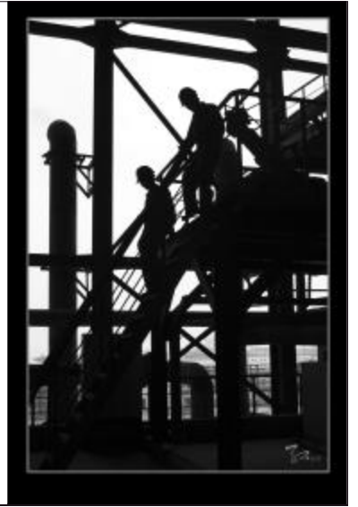
巡检途中 任卫红 八十万吨氧化铝厂