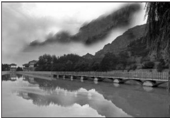
湖光幻影 王玉民 水电分厂