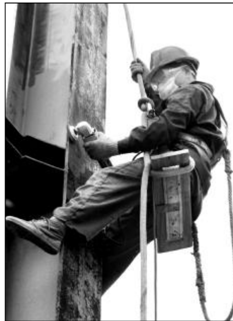
近日,2.5万吨氧化铝厂四车间对沉降过滤系统进行维护保养并实施色彩化管理。对两台沉降槽、两台过滤器、三台导料泵及现场裸露管道进行了除锈、抛光和防锈刷漆工作,初步解决了露天设备存在的锈蚀问题,同时也极大地改善了厂容厂貌。图为工作人员在2米高空对现场管道架进行除锈、抛

本报讯 9月6日,山西铝厂水泥厂回转窑系统大修完工,提前1天点火烘窑,并于7日下午4点开始投料生产。这次大修内容包括更换大窑内衬、窑口浇注料恢复、钢丝胶带斗提检修、窑头窑尾电收尘拉链更换等26项工程。为确保大修工作顺利、高质进行,水泥厂成立了大修领导机构和职能小组,制定了详细的安全技术措施和大修项目网络计划,对26项工程逐项确定工期目标,并指定专门的责任人和检查人,确保每个项目都有目标、有检查、有落实;坚持每天晨会和下午碰头会制度,汇报当天需要解决的问题,要求每项问题当天解决、当天落实,确保了回转窑系统大修的提前完工和顺利交付使用。(水一)