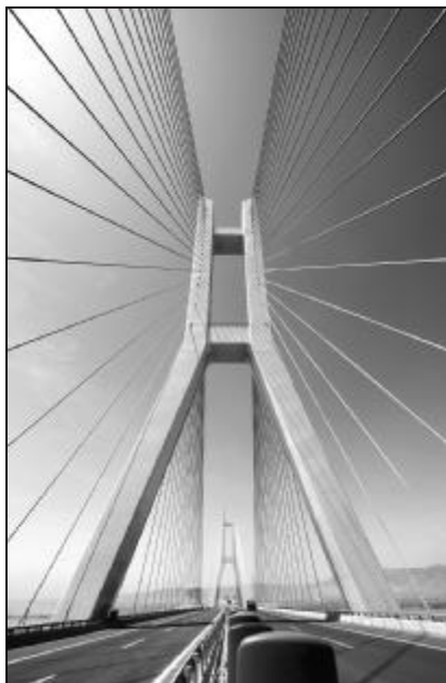
合力之聚 薛志礼 离退休管理服务中心