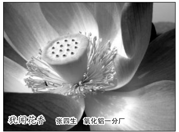
犹闻花香 张四生 氧化铝一分厂