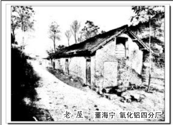
老屋 董海宁 氧化铝四分厂