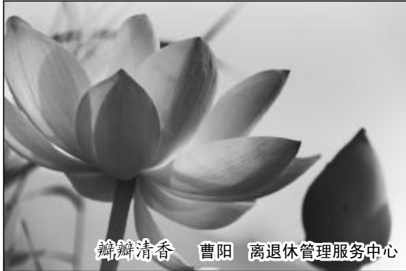
瓣瓣清香 曹阳 离退休管理服务中心