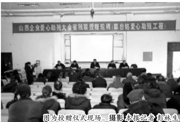
图为捐赠仪式现场。