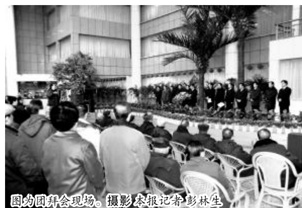
图为团拜会现场。