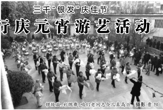
锣鼓敲、彩绸舞,咱们老同志今儿真高兴。

老同志们的兴致高,热烈地参加了各自所喜爱的活动项目。他们有的投飞镖、有的猜谜语、有的戴上大头娃娃敲锣,有的拿着奖票到领奖处兑奖,场内场外不时传来老同志们的阵阵欢笑。(徐敏)