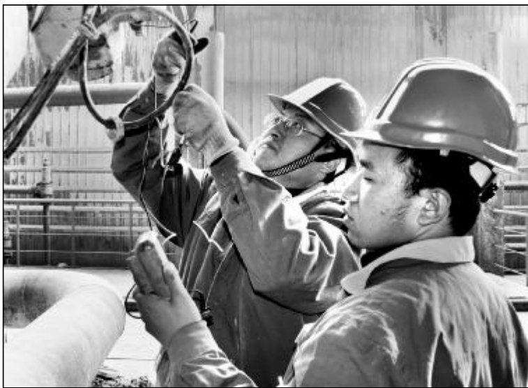
在节后第一个工作日,80万吨氧化铝厂装备科、点检站组织职能人员和点检员对分厂所属六个车间的设备进行了一次隐患大普查,此次普查主要针对重点设备的运转、润滑、泄露以及备用等情况进行了检查。共检查出问题20余项,并于目前全部安排处理完毕,为2008年的设备管理开了一个好头。图为点检站员工正对现场设备运行情况进行检测。